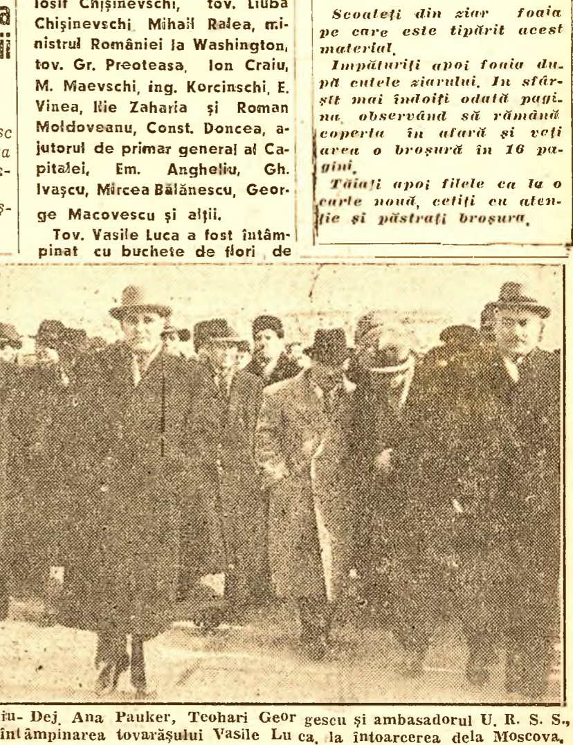
În clișeu: tov. Gh. Gheorghiu-Dej, Ana Pauker, Teohari Gheorgescu și ambasadorul U. R. S. S., S. I. Kavlaradze, au ieșit în întâmpinarea tovarășului Vasile Luca...