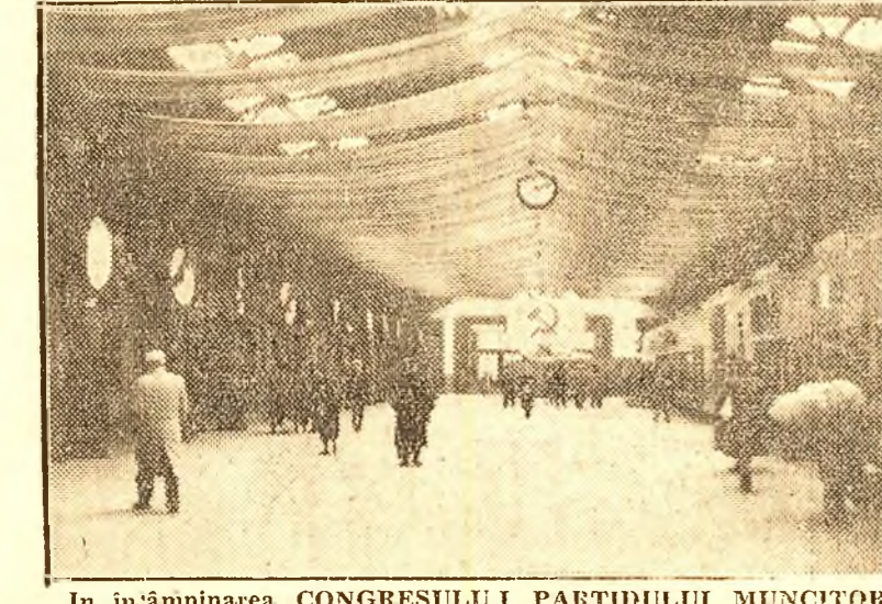
În întâmpinarea CONGRESULUI I PARTIDULUI MUNCITORES C ROMÂN, în orașul s'a îmbrăcat de sărbătoare...