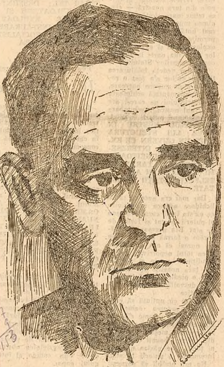
TOV. GH. GHEORGHIU-DEJ