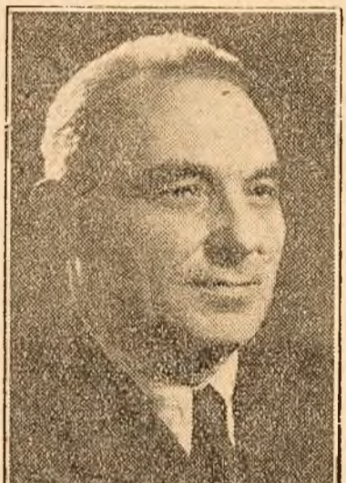
Tov. VASILE LUCA