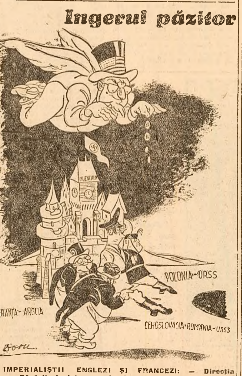
IMPERIALISTI ENGLEZI SI FRANCEZI: — Directia spre Rasarit, inainte marș!