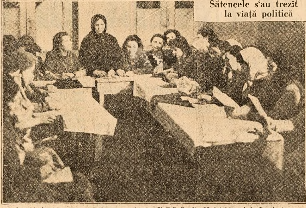
O sedinta de lucru pe plasa a organizatiei U.F.D.R. din Medgidia...