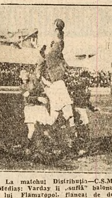
La meciul Distribuția-C.S.M. Mediaș: Varday II, suflă balonul lui Flamaropol...