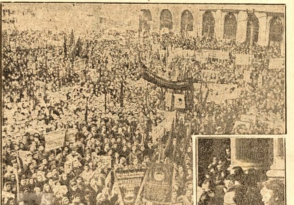
Doza sute de mii de femei s'au ingramădit, umăr lângă umăr, în Piața Universității și străzile din prejur, lăluie privind spre balconul de unde vorbește tov. Constanța Crăciun

— Emoționanta manifestație făcută tovarășei Ana Pauker de ziua internațională a femeii —