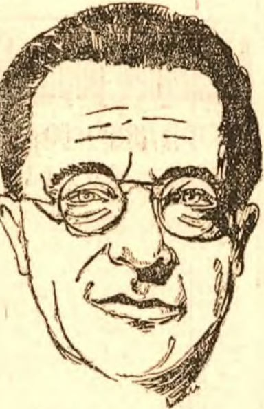
PALMIRO TOGLIATTI secretarul general al Partidului Comunist Italian

Stabilirea unei astfel de alianțe este despartire Europa în două: o parte în care se va realiza o democrație socialistă și o parte în care se va realiza o democrație imperialistă. Dacă mai continua așa — a spus Togliatti — cred că într-o bună zi domnia acestora vor hotărâți că Europa nu mai există deose.