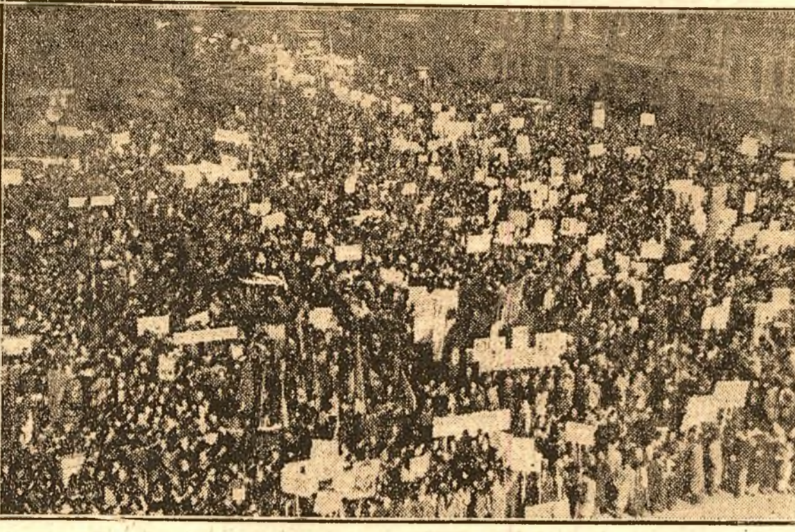
În Piața Libertății, cât cuprind cu ochii, marea nesfârșită. N'a mai cunoscut Clujul astfel de mulțimi...

Duminică 7 Martie. Încă d'n tren, după primele căsute delamăriașă orăzului, se cunoștea că la Cluj e o sărbătoare cum n'amai fost până acum. Erau împodobite cu cocarde, tablouri și așa împodobit a fost tot drumul până la gară. Acolo o mulțime mare de cetățeni a făcut o entuziastă primire delegației guvernamentale în frunte cu d. dr. Petru Groza și tov. Vasile Luca. Era o zi senină și — după cum spuneau clujenii — soarele iesise în propagandă electorală. Aerul era limpede și întreaga sărbătoare cea urmat avea ceva din căldura și prospețimea zilei, era sărbătorea unor vechi prieteni care au trecut prin clipe arele și acum se bucură împreună cu viitorul fericit pe care îl făuresc țării noastre.