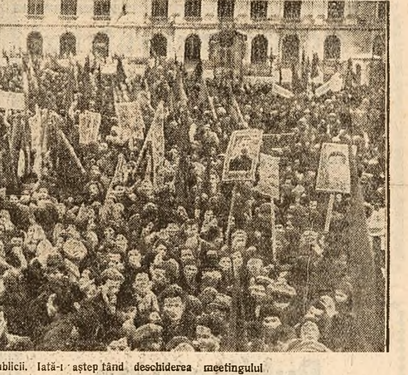
Zeci de mii de tineri s'au strâns în Piața Republicii, la- tă-ăștețând deschiderea meetingului

După meeting, zecile de mii de tineri au de- monstrat timp de două ceasuri în fața sediu- lui Consiliului Național al F. D. P., exprimân- du și hotărârea de a sprijini din toate puterile Frontul Democrației Populare.