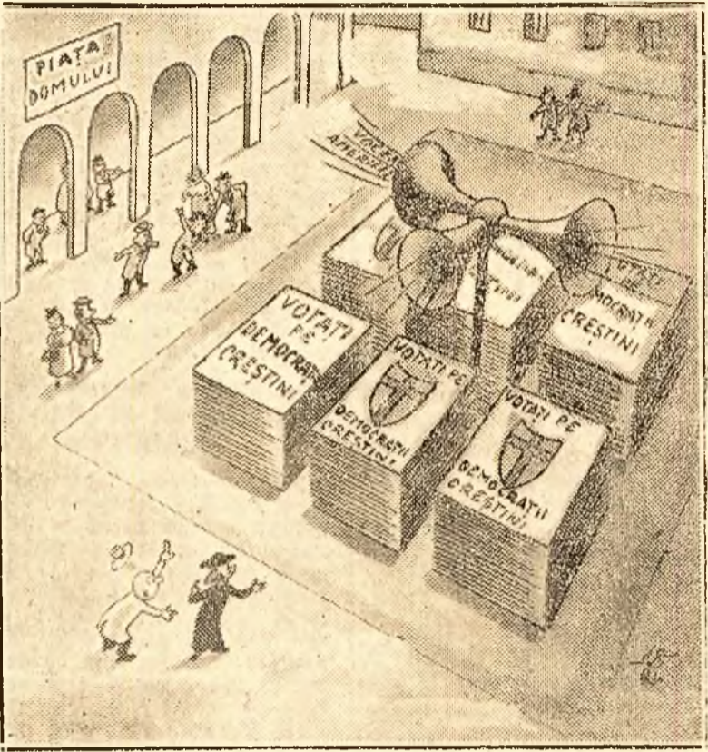
— Ce-i asta? a dispărut Catedrala? — Am vândut-o și am cumpărat în locul ei megafona și manifeste.

La Milano, Cardinalul Schuster, a intervenit direct și pe față în campania electorală — aruncând anatema asupra ceteșilor care vor vota Frontul Democrat Popular.