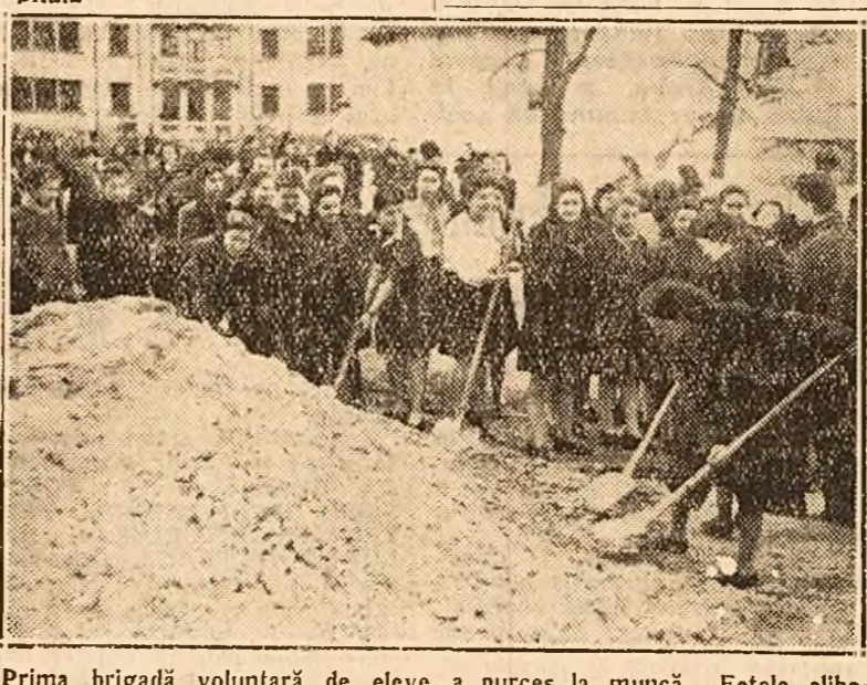
Prima brigadă voluntară de eleve a început construirea unui parc sportiv

Director, Subdirector, (ss) T. Teodorescu