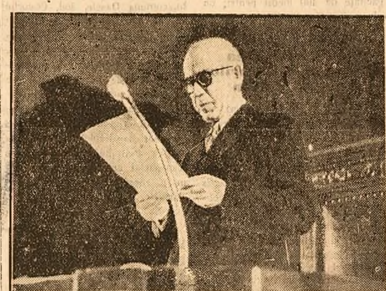
Prof. C. I. Parhon, Președintele Prezidiului Provizoriu al R. P. R., rostind cuvântul de deschidere a primei sesiuni a Marelui Adunări Naționale.

Doamnelor și Domnilor Deputați, În numele Prezidiului Provizoriu al Republicii Populare Române salutăm cu deosebită căldură pe reprezentanții poporului, pe aceia cari au menirea de a constitui Marea Adunare Națională, organul suprem al puterii de Stat al Republicii noastre Populare.