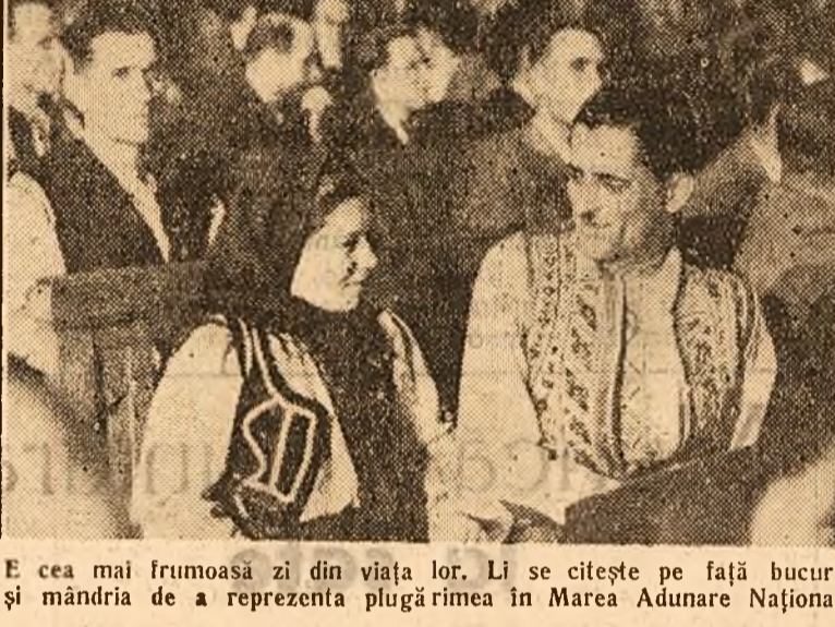
E cea mai frumoasă zi din viața lor. Li se cetește pe față bucuria și mândria de a reprezenta plugarimea în Marea Adunare Națională