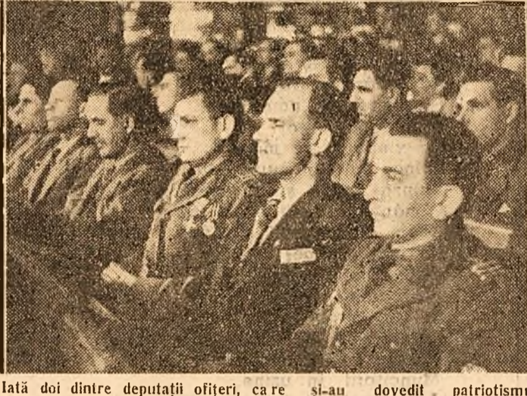
Iată doi dintre deputații ofițeri, care se-au dovedit patriotismul pe fronturile de luptă împotriva hitlerismului