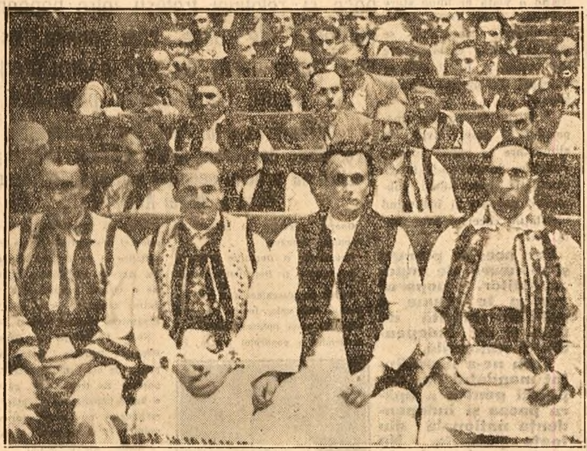
In fotografia: un grup de deputați ai plugărimii