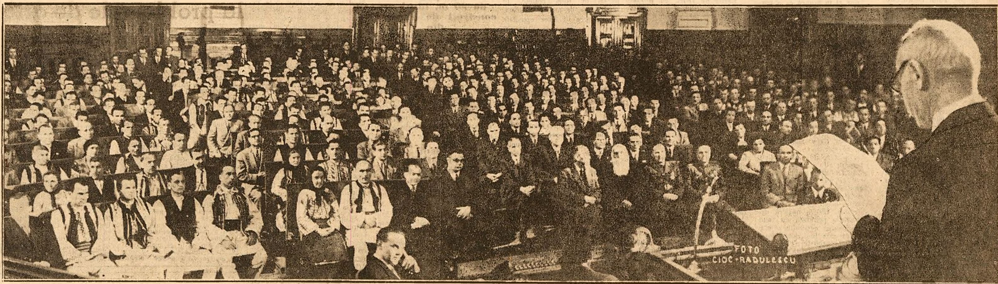
Un aspect al ședinței de Marți a Marelui Adunări Naționale, în timpul citirii cuvântului de deschidere al prof. dr. C. I. Parhon. În locul exploatoarelor și jefuitoarelor poporului muncitor din parlamentele burgeo-moșierești de odinioară, în Marea Adunare Națională au intrat cei mai buni și mai devotați fii ai poporului: muncitori, plugari, cărturari, militari, meseriași, femei și tineri.

— a spus Prof. C. I. PARHON, Președintele Prezidiului Provizoriu al R.P.R., în cuvântul de deschidere a sesiunii