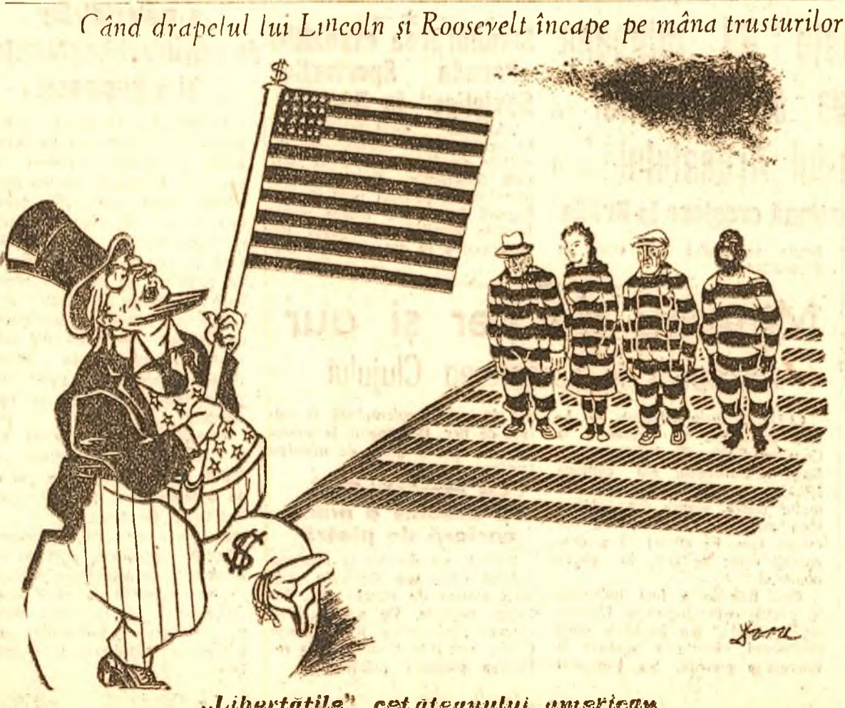
„Libertățile” cetățeanului american

Am lăsat dat odă la pentru totdeauna dispuțată asupra frontierei și deacum înainte scopul nostru este ca sprijinindu-ne reciproc, să ridicăm cât mai mult bună starea și cultura popoarelor noastre. — a spus noul ministru.