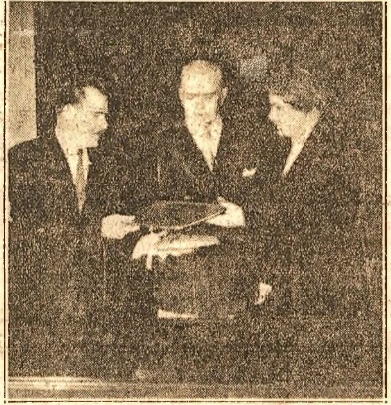
În prezența d-lui dr. Petru Groza, tov. Ana Pauker și Dimitar Ganev, procedeză la schimbul instrumentelor de ratificare. (Reportaj în pag. 3-a)