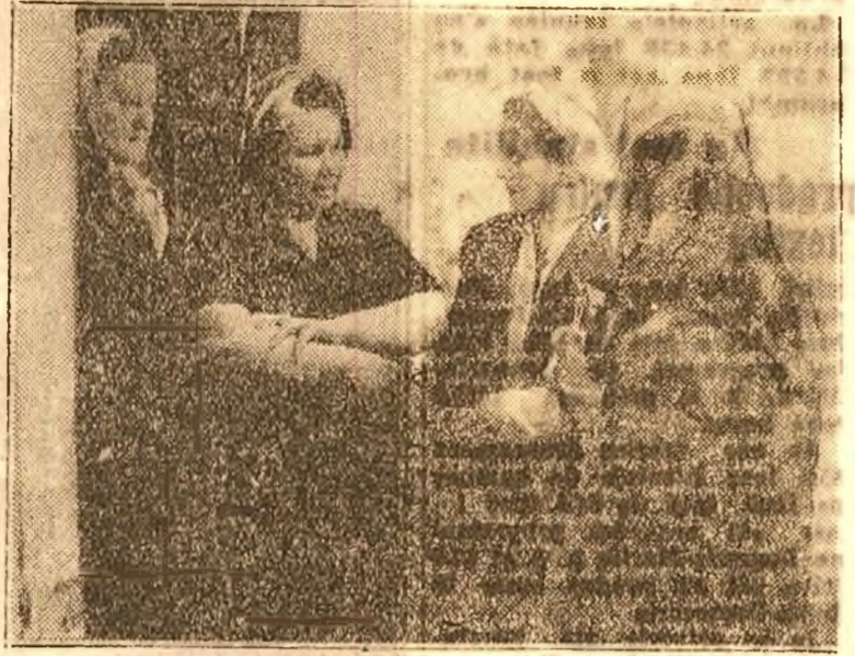
Indrumatoarele la lucru

Nu mai fusesem de câteva luni în Militari și de cum am intrat în comună, m'a izbit atmosfera de muncă febrilă și viață clocoțitoare ce a pus stăpânire pe această margine de București. Șoseaua toată a prins viață și din caldarâmii răzității de târnăcoape, din