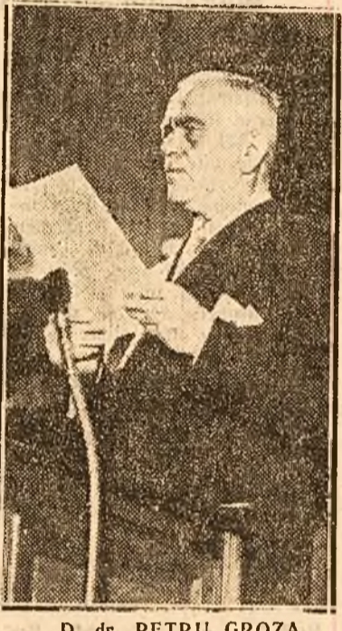
D. dr. PETRU GROZA