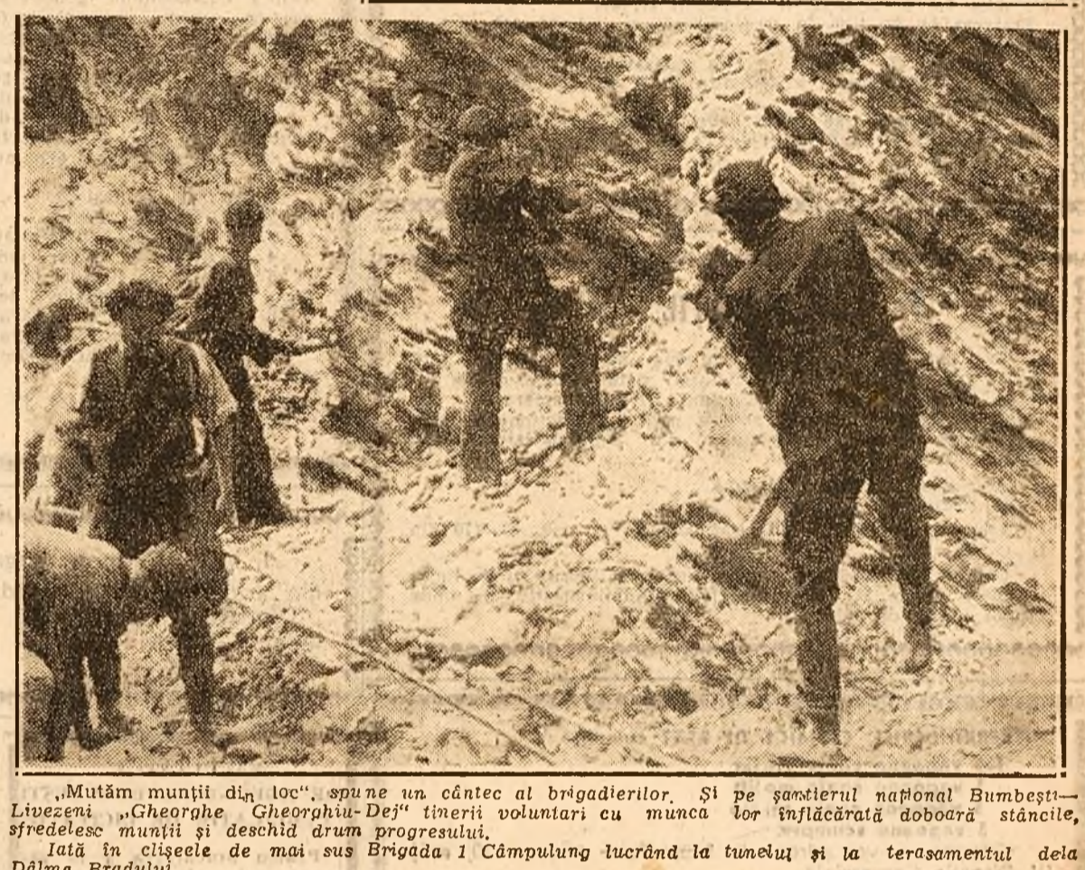
„Mutăm munții din loc“, spune un cântec al brigadierilor. Și pe șantierul național Bumbesc-Livezeni „Gheorghe Gheorghiu-Dej“ tinerii voluntari cu munca lor înflăcărată dobândă stăncile, sfredelesc munții și deschid drum progresului. Iată în clișeele de mai sus Brigada 1 Câmpung lucrând la tunelul și la terasamentul dela Dâlma Bradului.