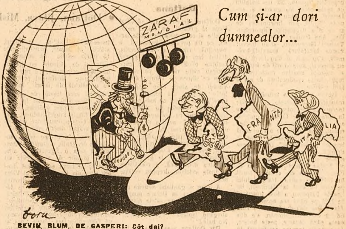
BEVIN BLUM, DE GASPERI: Cât dai? UNCHIUL SAM: Sunteți doar clienți vechi, n'o să ne certăm noi!

Cu prilejul serbărilor pentru aniversarea a 600 de ani dela întemeierea Universității din Praga, un număr de profesori și savanți cu renume mondial dela alte universități au primit titlul de doctor „honoris causa“ al Universității din Capitala Cehoslovaciei. Printre aceștia se află și Prof. C. I. Parhon, președintele Prezidiului Provisoriu al Republicii Populare Române. (Telegrama în pag. VI-a)