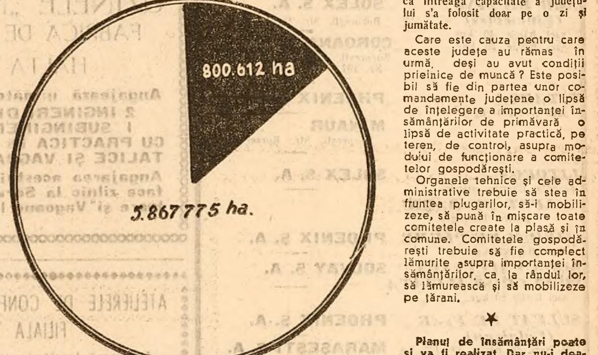
Suprafața însămânțată până la data de 3 Aprilie. Suprafața rămasă de însămânțat.

Dezbaterile Marelui Adunări Naționale asupra Proiectului de Constituție a Republicii Populare Române.