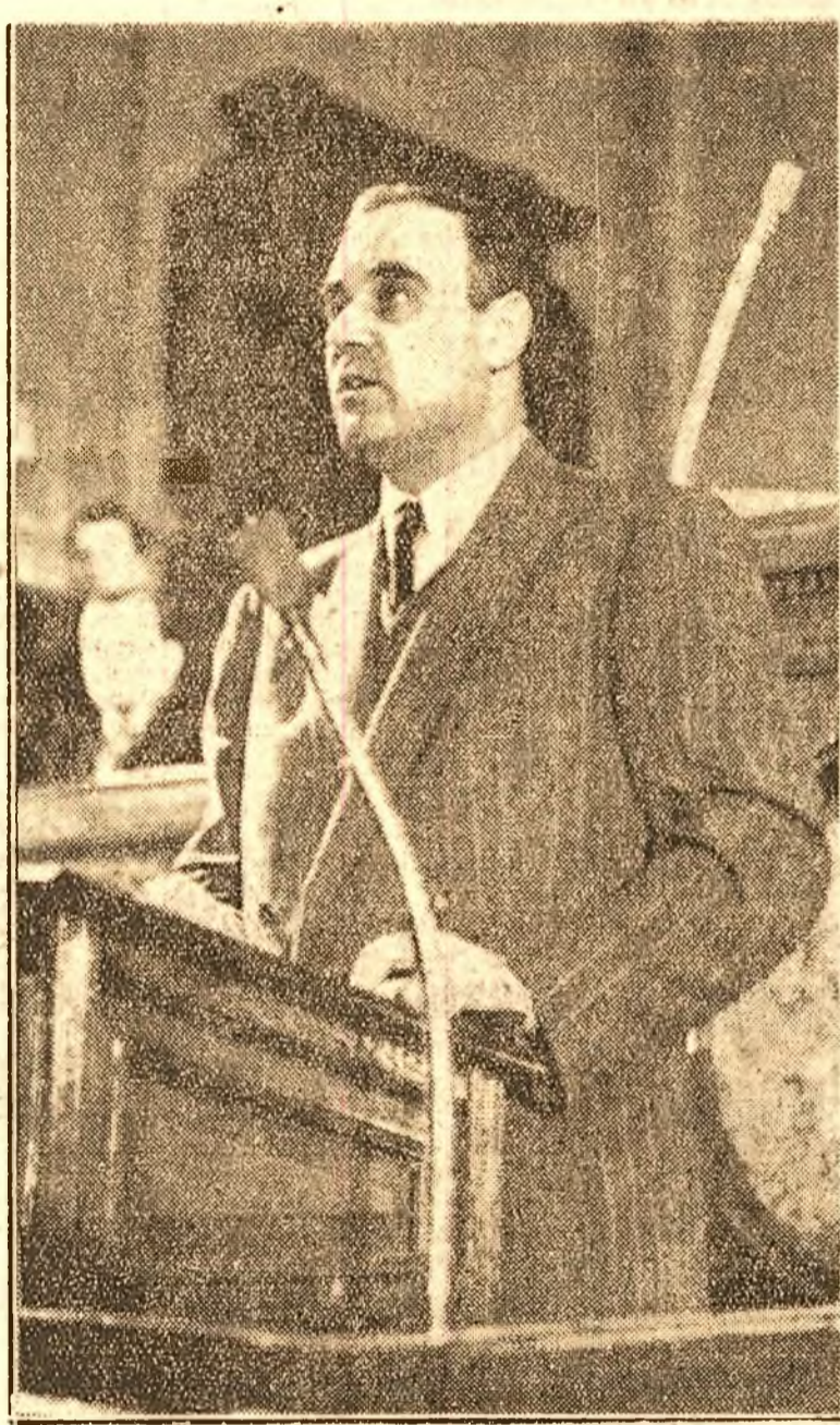
Tov. GH. GHEORGHIU-DEJ