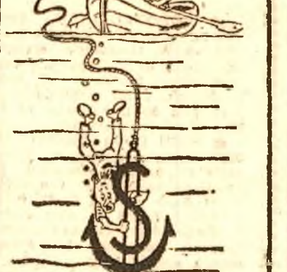
Planul american de subjugare a Europei de Vest pringă că „planul Marshall” reprezintă o ancoră de salvare pentru economia europeană.

Vă prezentăm marele șantier național „ANA PAUKER”