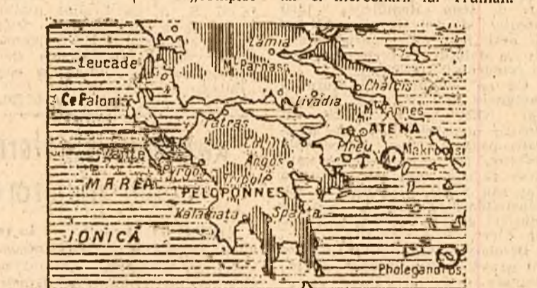
HARTA PELOPONEZULUI. Regiunile hasurate sunt cele eliberate de trupele generalului Markos

lăre au capturat un aerodrom și 70 de membri din personalul lui au trecut în rândurile armatei populare democratice. „COMLOT ÎMPOTRIVA REGIMULUI“ ÎN FLOTA MONARHO-FASCISTA ATENA, 13 (Rador). — Radio Grecia Liberă anunță că mini- strul marinei din guvernul monar- ho-fascist a declarat că 14 ofi- țeri activi ai marinei de război, 14 ofițeri puși în disponibilitate ca ocazia „epurărilor“, 33 de sub- ofițeri și 50 de marinari vor fi deținuți de o curte marțială. Ei sunt acuzați de „complot împotriva regimului“.