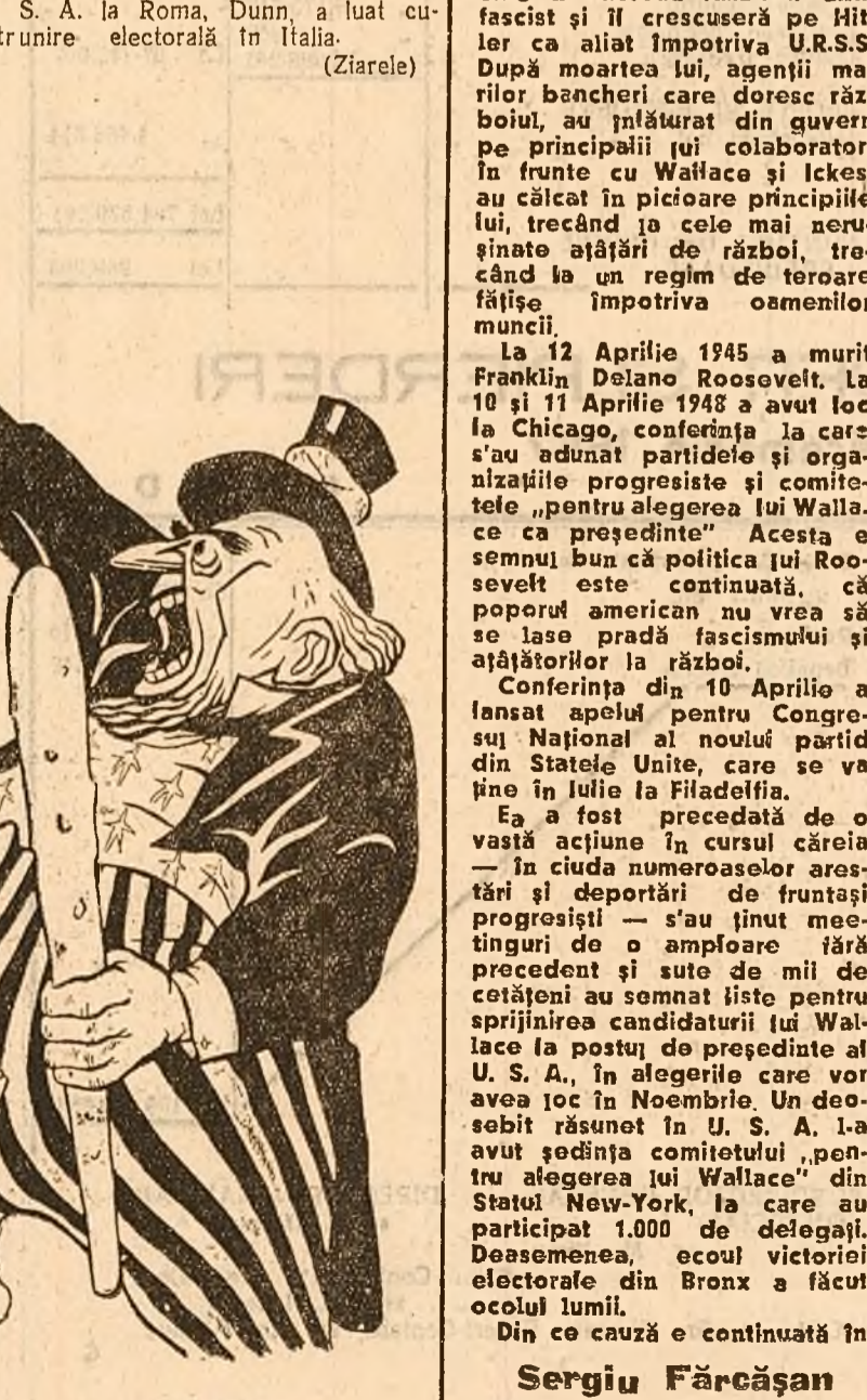
MISTER DUNN: — Dollarizați-vă, că vă țel!

Ministrul U. S. A. la Roma, Dunn, a luat cuvântul la o întrunire electorală în Italia. (Ziarele)