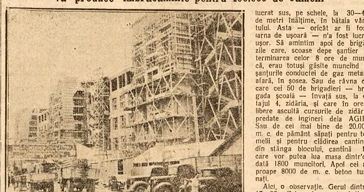
Această lucrare gigantică a început abia acum trei luni. Ea trebuie să fie terminată la 1 Mai, și va fi...

Brigadierii și muncitorii au construit, în plină iarnă, o uzină care va produce îmbrăcăminte pentru 400.000 de oameni