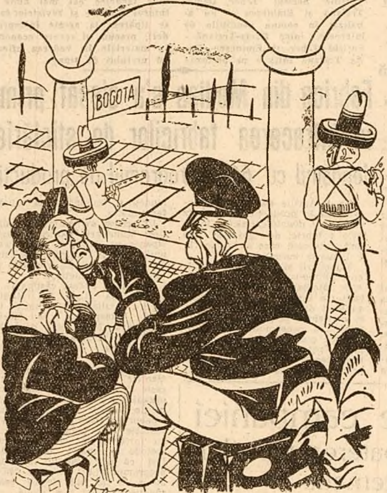
MARSHALL: Mi se pare că și aici au fost dusi trenul...

conferința pan-americană, secretarul de Stat Marshall și majoritatea membrilor delegației nord-americane au fost puși în siguranță în afara orașului, unde se găsește sub protecția soldaților columbieni. Alte 18 personalități americane au fost evacuate în grabă în Statele Unite cu avioanele.