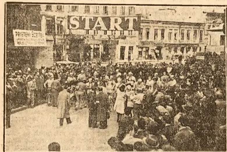
Mai sunt câteva clipe până la plecarea din București. Se pun numerele și se face apelul. Febra cursei nu va mai fiine mult...

Cursa a fost splendidă. Pe tot parcursul sute de cetățeni din Valea Prahovei au întâmpinat pe cicliști cu arcuri de triumf și numeroase daruri aduse de muncitorii depe Valea Prahovei.