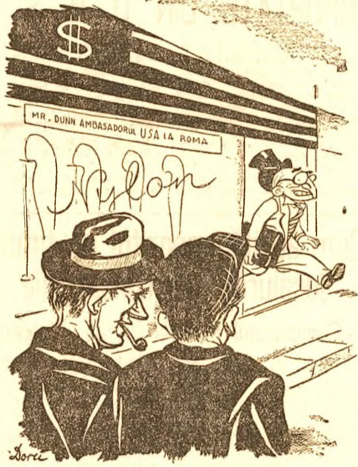
— Ce-o fi căutat De Gasperi în dugheana asta? — S'a dus să afle cum s'a ales deputat Truman în 1934 cu 40.812 voturi într'un district în care erau... 25.000 cetățeni cu drept de vot.

Formând un coridor viu dela Arcul de Triumf până la „Scântea”, unde era punctul final al cursei, zeci de mii de cetățeni din Capitală au luat parte Duminică la