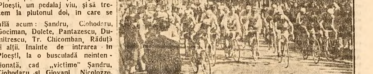
Pe un timp minunat steagul starterului a căzut: s'a dat plecarea din Predeal!

Primii doi, încalecă repede dar nu vor mai ajunge plutonul care, sesizând momentul, a „rupt-o la