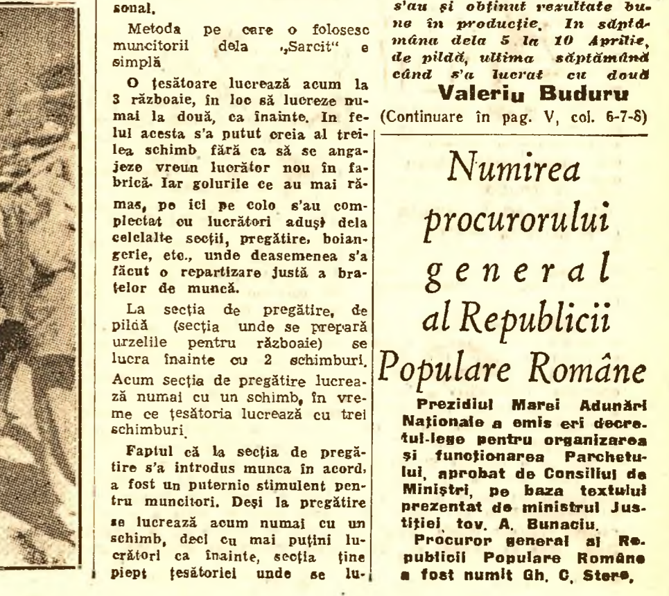
4. În Sicilia au fost asasinși de bandele fasciste 35 de fruntași ai muncitorimii (în clișeu) Corpul neînsuflețit al unui muncitor italian răpus de gloantele fascistilor, este purtat pe umeri de tineri membri ai Frontului Democratice Populare.