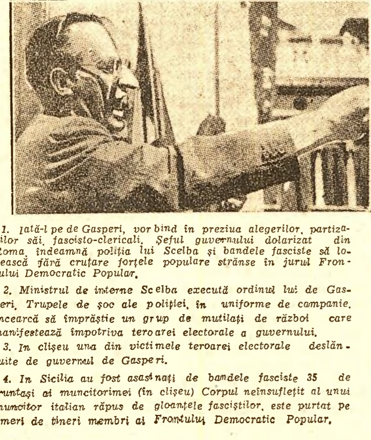
1. Întâ-l pe de Gasperi, vorbind în preția alegerilor, partizanilor săi, fascisto-clericali. Șeful guvernului dolarizat din Roma, îndeamnă poliția lui Scelba și bandele fasciste să lovească fără cruțare forțele populare strănse în jurul Frontului Democratice Populare.