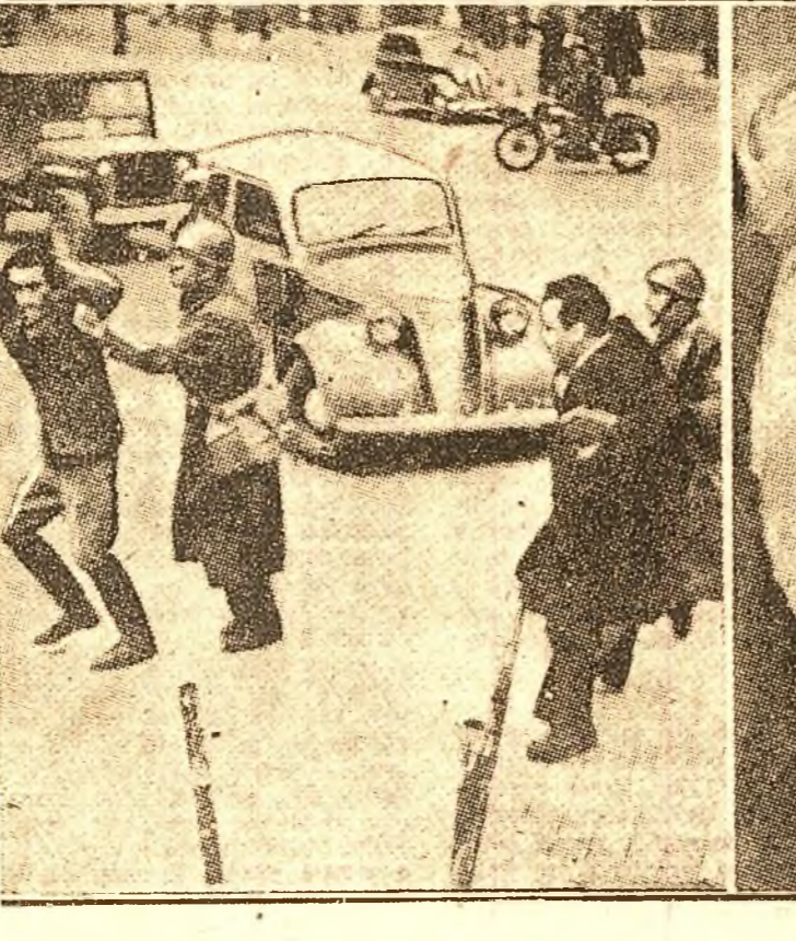
2. Ministrul de Interne Scelba execută ordinul lui de Gasperi, Trupele de șoc ale poliției, în uniforme de companie, încearcă să împrăștie un grup de mii de război care manifestează împotriva teroarei electorale a guvernului.