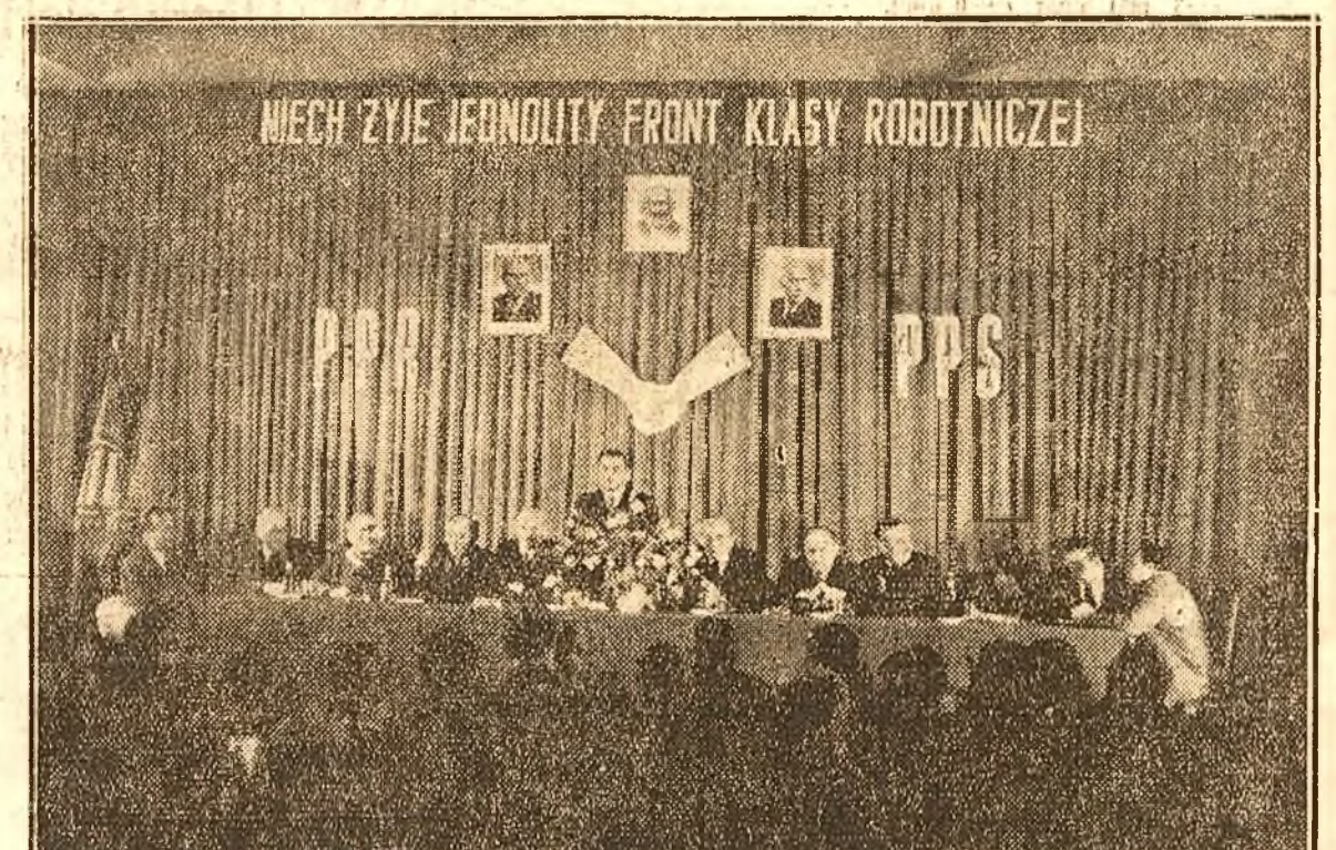
Sedința comună a Comitetului Central Executiv al Partidului Muncitoresc Polon și a Comite-tului Executiv al Partidului Socialist Polon — în Parlamentul Polon, în ziua de 3 Aprilie 1948. În clișeu: Ministrul RUSINEK deschide sedința. În tribuna Prezidiumului, au luat loc (dela stînga la dreapta): KLISZKO; SWIATKOWSKI; LANGE; primul ministru CYRANKIEWICZ; vice-mareșalul SZWALBE; vice-premierul GOMULKA precum și alți fruntași ai celor două partide.

In pag. IV-a Valorificarea masivelor păduroase din Valea Bistriței de C. Prisnea Prefectul Jud. Neamț