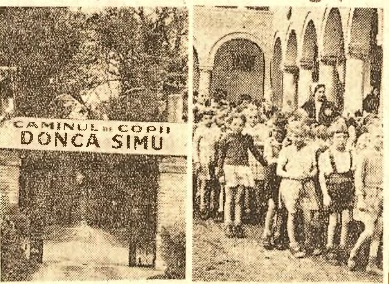
Un grup de 5 cămine de 21, pentru 300 de orfani, a fost inaugurat Duminică dimineața în comuna Mogoșoaia, prin grija și munca Direcției Generale a Asistenței din Ministerul Muncii, Comitetul Național al Copiului, U.E.D.R. și Crucea Roșie. Cel mai mare din grupul celor 5, căminul „Donca Simu”, pe care îl înfățișează clișeuul nostru, a fost instalat în clădirea fostului castel Bibescu, rezervat înainte numai pentru oșpeții „nobilei” familii. (Reportaj în pagina V-a)