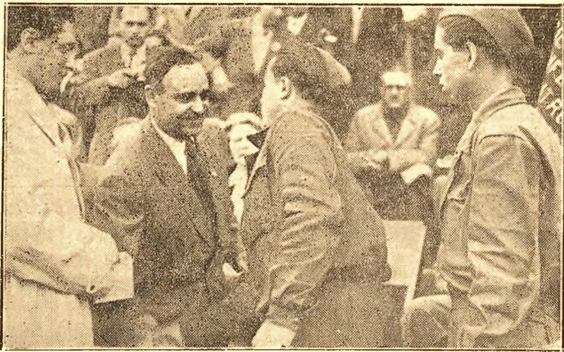
Tov. Gh. Gheorghiu-Dej strânge mâna brigadierilor fruntași ai muncii de pe șantierul APACA.

Inaugurarea noii fabrici de confecții din cartierul Cotreceni