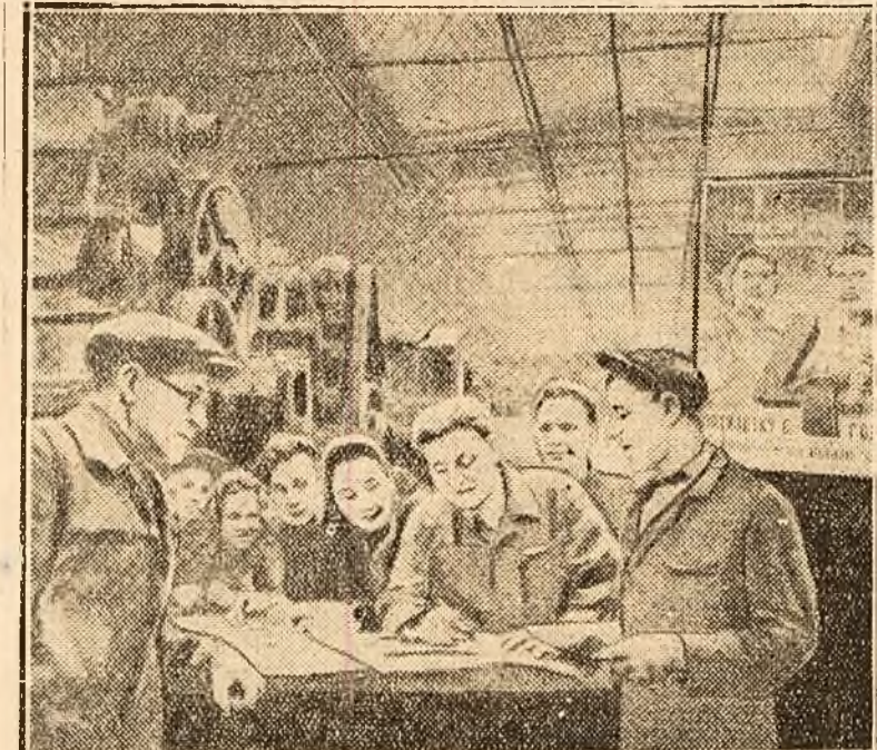
Muncitorii dela unul din atelierele uzinei de automobile „Stalin“ din Moscova, subscriind la imprumutul sume importante din economiile lor.

MOSCOVA, 6 (Rador). — TASS transmite: Ministrul Finanțelor din URSS, Kossigin a