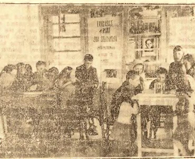
La clubul de copii „1 Mai” din București Noi

În întâmpinarea zilei de 1 Mai, cetățenii Capitalei și mai ales femeile încadrate în Uniunea Femeilor Democratice, au pornit o adevărată campanie de gospodărie în tot orașul. Spre folosul cetățenilor și mai ales al copiilor, nici un mail-dan, nici un teren virat, sau rămână necurățat, neînfrumusețat. Peste 50 de grădinițe, solari, cluburi de copii au fost inaugurate în ziua de 1 Mai, pe locuri unde, nu cu multe zile înainte, zăceau mormene de quoașe și pu-truziciuni.