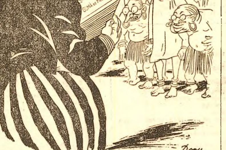
UNCHEIUL SAM: Bateji tam-tam-ul și anunță că a venit ajutorul american.

Planul Marshall transformă țările din apusul Europei în colonii ale imperialismului american.