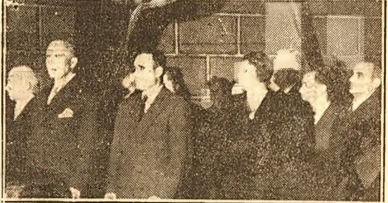
Membrii guvernului, la festivitatea de la Ateneu. De la stînga la dreapta: Prof. dr. C. I. Parhon, d. dr. Petru Groza, tov. Gh. Gheorghiu-Dej, Ana Pauker, d. Mihail Sadoveanu, tov. Teohari Georgescu și Vasile Luca.