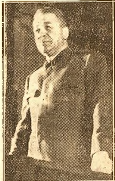
Tov. Emil Bodnăraș vorbind.

Voința poporului român exprimată în proclamația de la Islaz trebuia înfrântă.