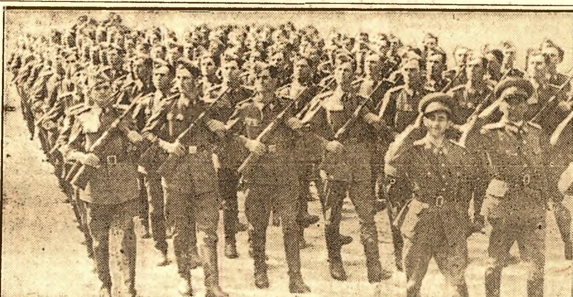
Unități ale armatei R. P. R., delând în ziua de 1 Mai.