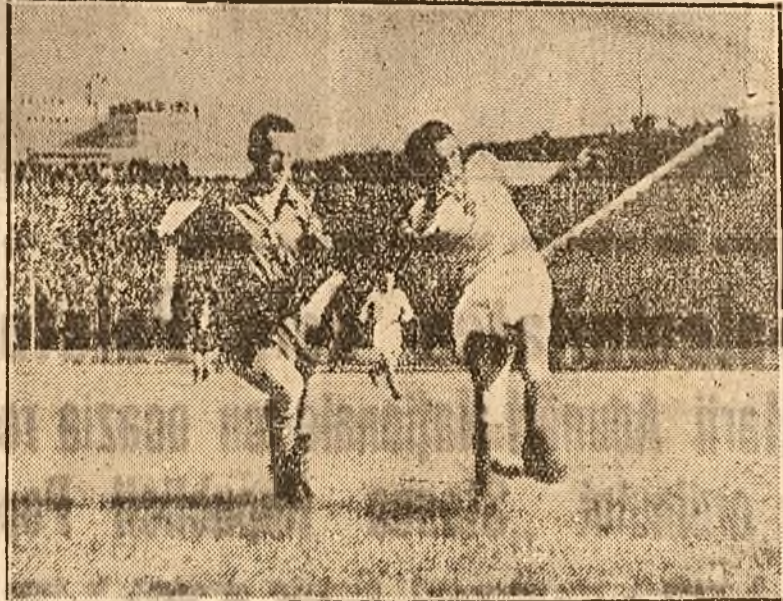
MINUTUL 2. Ozon a trecut de Pană și în secunda următoare va trage și va marca

Numeroșii simpatizanți ai formației lui Ozon, au plecat Duminică după amiază de la stadionul Giulești. Echipa lor favorită, pe care anul trecut înfrunzise de încheierea campionatului, o vedeau concurend cu succes la titlul național, a fost retrogradată direct în Divizia B.