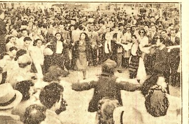
În piețe publice, în grădini, horele în țara lor, plini de încredere, cetățenii Republicii Populare Române au sărbătorit Duminică 9 Mai, adevărata Zi a Independenței,