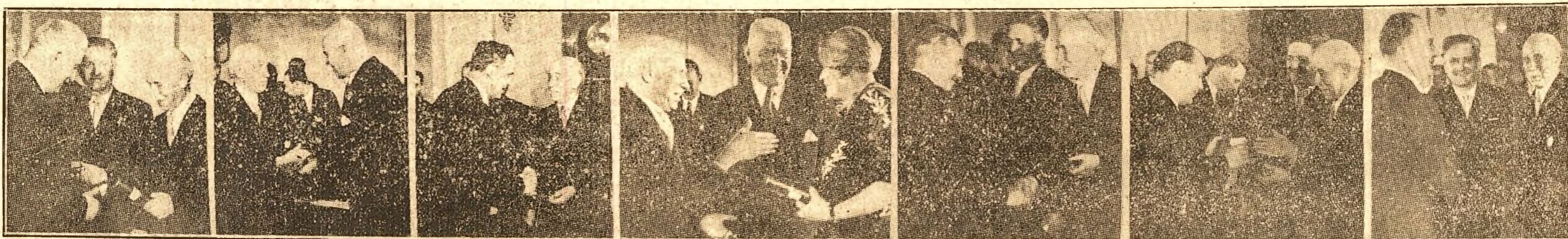
Aspecte dela solemnitatea înmănării ordinului „Steaua Republicii Populare Române”. Prof. C. I. Parhon înmănează decorația și felicită pe: ambasadorul U. R. S. S. Kavaradze, dr. Petru Groza, tov. Gh. Gheorghiu-Dej, Ana Pauker, Vasile Luca, Teohari Georgescu, Lotar Rădăceanu