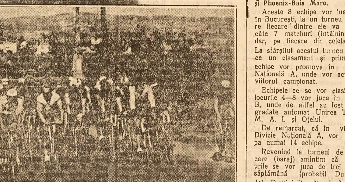
CURSA CICLISTA PRAGA - VARȘOVIA. Plutonul este condus de Dumitru Pantazescu, Se remarcă Nae Chicomban izolat în dreapta.