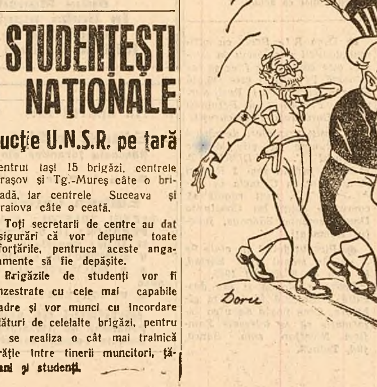
Centrul Iași 15 brigăzi, centrele Brașov și Tg.-Mureș câte o brigadă, iar centrele Suceava și Craiova câte o ceată.