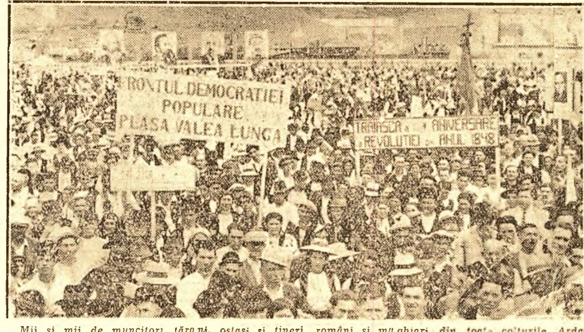
Mii și mii de muncitori, țărani, ostași și tineri, români și maghiari din toate colțurile Ardealului, au venit la Blaj, pe Câmpia Libertății, pentru a sărbători cea de a 100-a aniversare a Revoluției din 1848.

Discursurile rostite pe d. prim-ministru dr. Petru Groza și tov. Miron Constantinescu, membru al Biroului Politic al C. C. al P. M. R. și ministrul Minelor și Petrolului