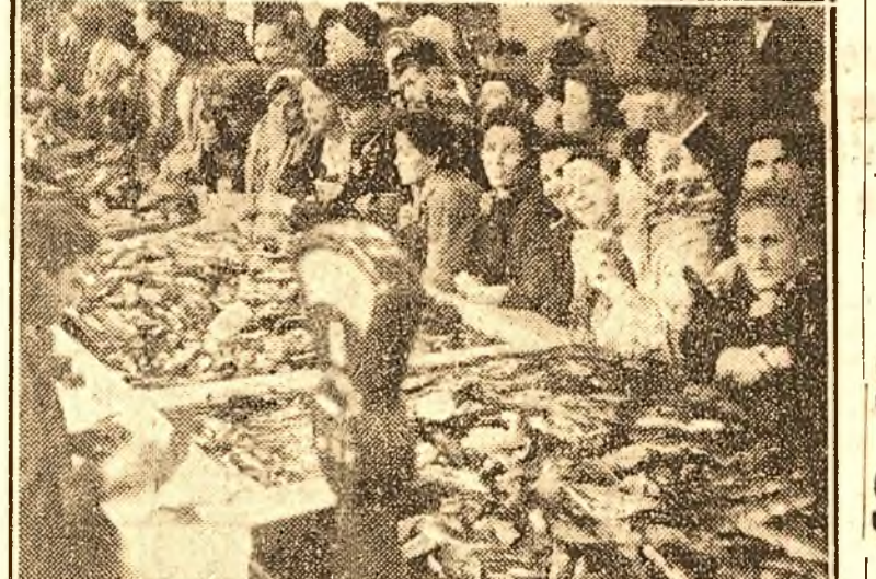
Eri a fost inaugurată noua hală de pește din Piața Obor. În clisou: primii cumpărători în noua hală a societății de Stat „Rompeșcară”