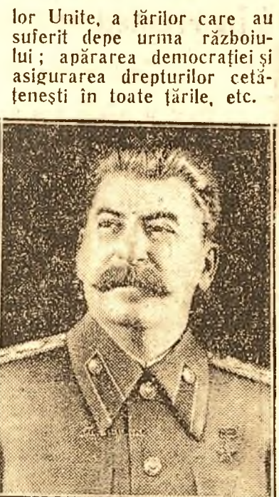
Poți fi sau nu de acord cu programul lui Wallace. Un singur lucru este totuși neîndoios: Nici un om de stat, preocupat de pace și colaborarea între popoare

Moscova, 18 (Rador). — TASS transmite textul răspunsului lui I. V. Stalin la scrisoarea deschisă a lui Wallace: