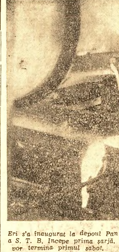
Eri s'a inaugurat la depoul Panduri prima turnatorie de fontă a S.T.B. Incepe prima sarja. Peste câteva minute, muncitorii vor termina primul sabot.