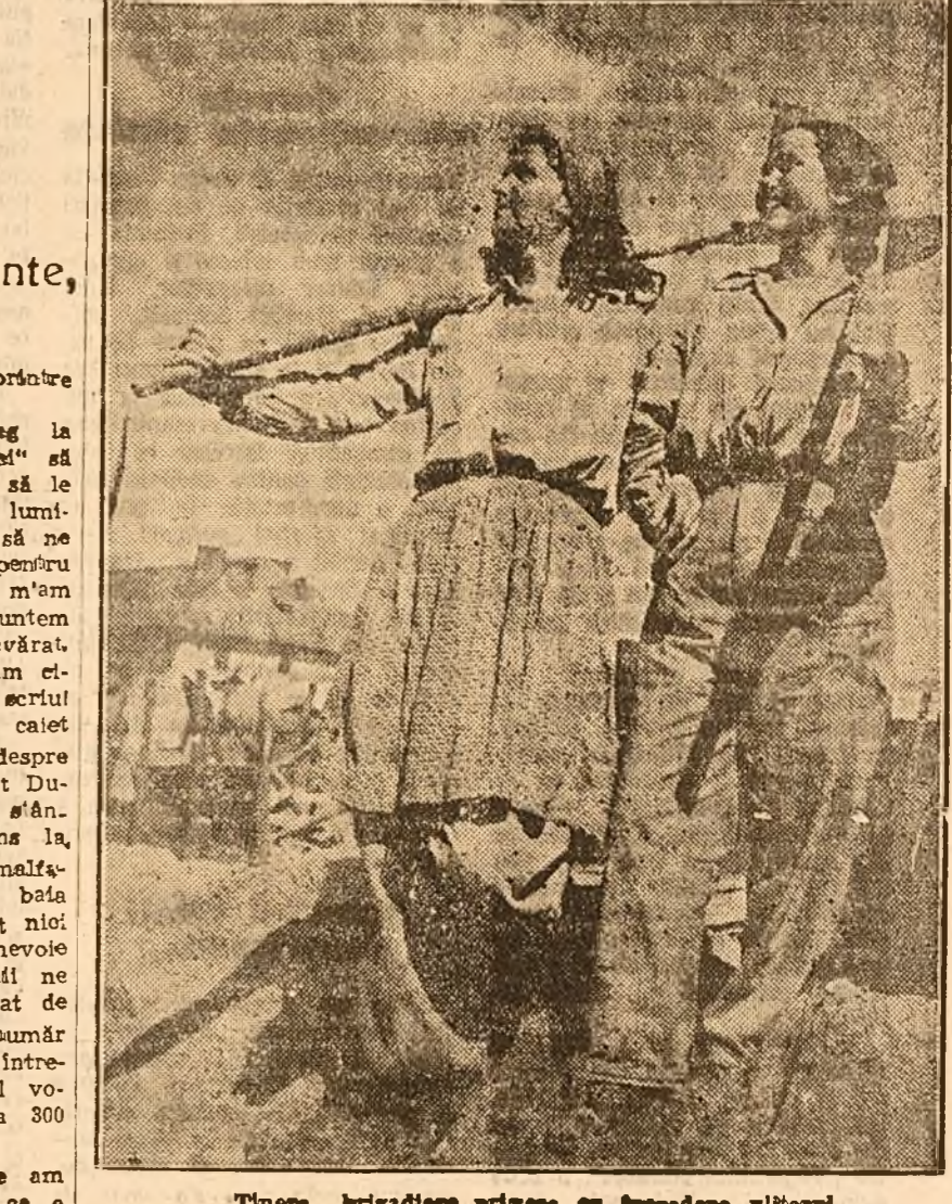
Tinere brigadiere private cu încredere vitorul