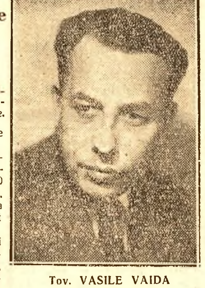
Tov. VASILE VAIDA

Eri a avut loc ședința Comandamentului Unic de însămânțări, în care tov. Vaida Vasile, ministrul Agriculturii, a arătat rezultatele campaniei de însămânțări, felul cum s'a desfășurat campania și sarcinile care trebuie îndeplinite în vederea asigurării unei recolte sporite. 20.000 tone ovăz și 15.000 tone orz. Toate semințele au fost distribuite la prețurile oficiale de colectare, și anume: grâu, — 5,60 lei kgr., ovăz, — 5,30 lei kgr., și orz, — 4,70 lei kgr., ceace a constituit un imbold deosebit pentru plugarii noștri. În același timp, pentru plugarii lipsii, cu pământ puțin, semințele au fost distribuite pe credit, cu restituirea în natură la recoltă. Sunt județe care au primit cantități foarte mari de semințe de grâu, orz și ovăz, de pildă: Constanța, 14.525 tone; Tulcea, 8.183 tone și Covurlui, 3.447 tone, etc. Circa 5 miliarde lei credite au fost puse la dispoziția țăranilor de B. N. R. pentru procurarea de vie de muncă, unelte, mașini și semințe.