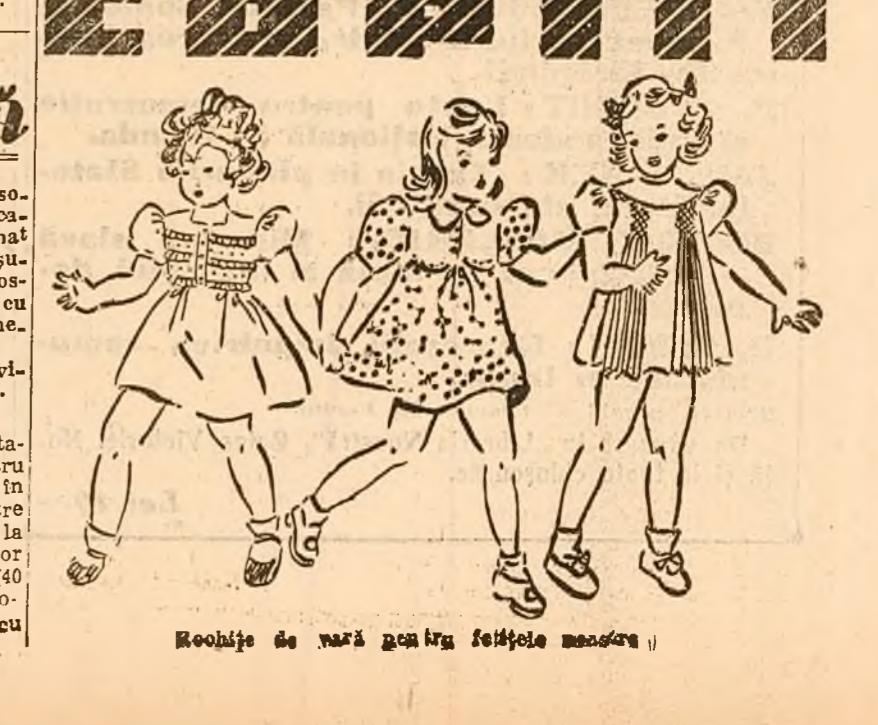
Rochițe de țară pentru țetețele noastre