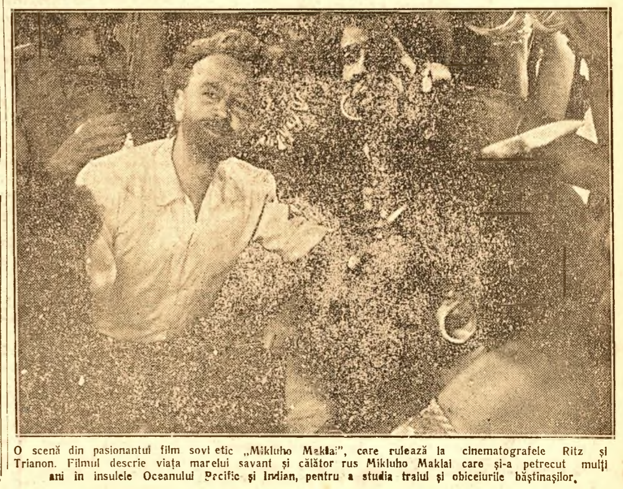
O scenă din pasionantul film sovietic „Mikluho Mekla”, care rulează la cinematografele Ritz și Trianon. Filmul descrie viața marelui savant și călător rus Mikluho Makla care și-a petrecut mulți ani în insulele Oceanului Pacific și Indian, pentru a studia traiul și obiceiurile băștinășilor.