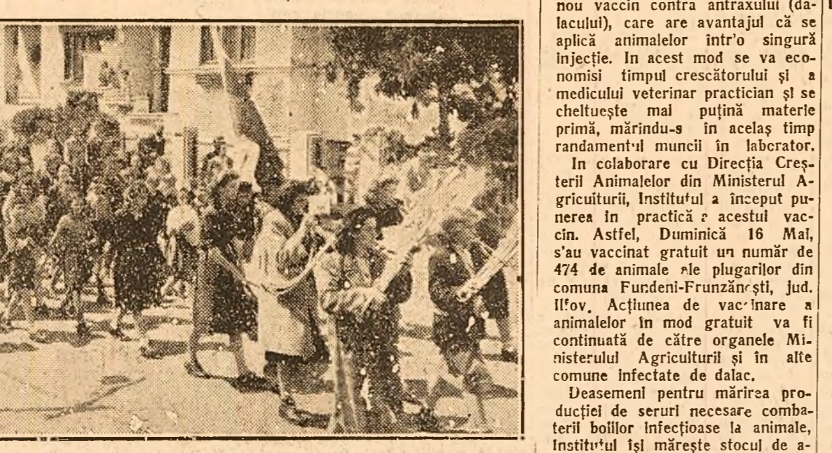
Grupul elevilor bulgari sosiți ieri în Capitală. În drum spre sediul Central al UAER unde a fost primit într-un cadru sărbătoresc de elevii școlilor din Capitală

Sosirea delegației elevilor bulgari care vizitează țara noastră