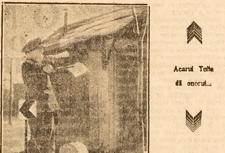
Acarul Tolia și onorul...

Iată să vedem unde duce în Uniunea Sovietică grija de a da