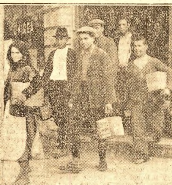
„Cu cât vin dem Statului mai multe grâne, cu atât el poa te aduce din străinătate mai mult bumbac, mai multe mașini și unelte agricole.”