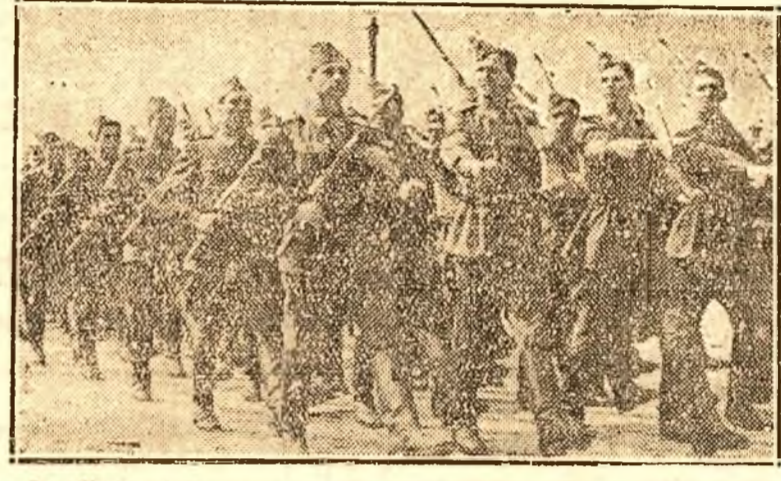
În clipa: Ostași ai Armatei Republicii Populare Române defilând în noule uniforme

Probleme ideologice Caracterul Statului în Republica Populară Română — învățătura marxistă-leninistă despre Stat — de ZINA BRANCU