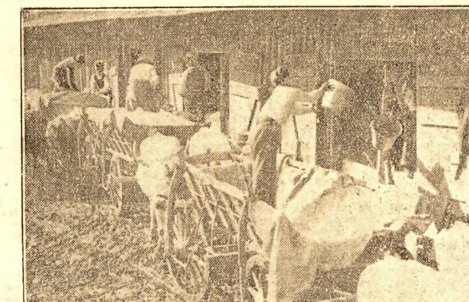
„Dă-i zor, că vreau și eu să cumpăr bumbac! În două săptămâni să-mi țese nebasta până de cămășe”