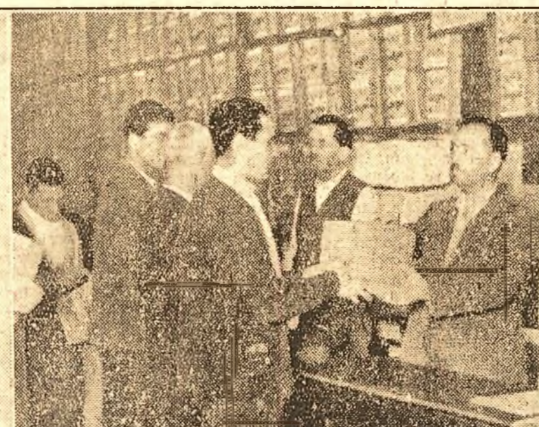
„De vindeam porumbul la speculanți, n'am fi văzut bumbacul acum”