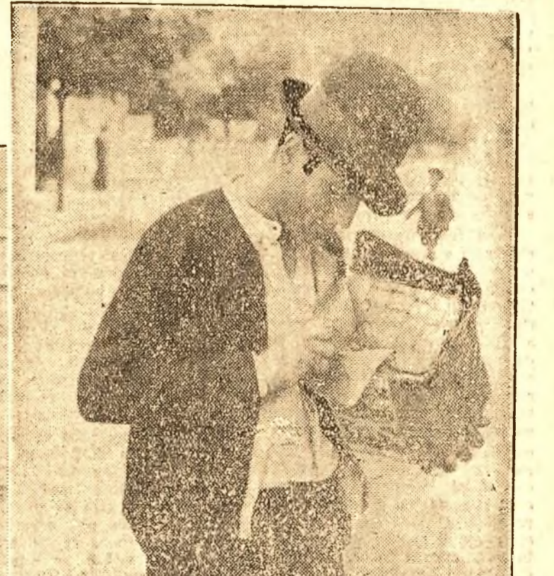
„În doi două fire... Și i de 14.”

La Centrul de cumpărare al Societății de Stat „Romceal” din Alexandria, plugarii teleormaneni descață porumbul vândut Statului pe preț bun. Cu banii căpătați pe porumb, ei pot să-și cumpere acum bumbacul trimis de Stat sateilor.