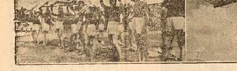
Proape 100 concurenți din 8 centre ale țării (secțiile aviației C.F.R., Malaxa, Wolff-București, secția aviației C.F.R. Tg-Mureș, centrul aviației universitar Cluj, centrele aviației sportive din A-rad, Timișoara, Galați) s'au prezentat la concursul de aeromodelism disputat pe aerodromul „Romero Popescu”. Cele peste 200 modele, perfect executate și ireproșabil prezentate la concurs, au

Echipa națională va avea un program special de antrenament, în vederea plecării în jurul lui 15 iunie la Varșovia, unde va disputa revanșa cu Polonia. Nu a putut obține informații prea clare asupra componenței echipei care va pieca, iar cele pe care le-am obținut dovădesc, din partea organelor federale, o greșită politică în selecționare și față de jucători menținerea unei atmosfere nesănătoase.