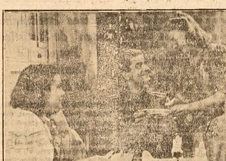
O scenă din filmul „Inima noastră”

Vorbind despre legătura dintre fantezie și realitate, Lenin dă odată într-un articol al său cuvintele lui Pleșcov: „Dezacordul dintre fantezie și realitate nu aduce nimic papăbuz, dacă persoana care visează crede cu adevărat în visul său, dacă adăncie viața cu atenție, compară observațiile cu lucrarea și în general dacă lucrează conștiințos la realizarea fanteziei sale. Când există legătură între vis și viață, totul merge de minune”.