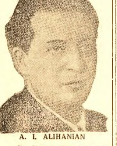
A. I. ALIHANIAN Academicienii sovietici A. I. Alihanov și A. I. Alihanian, cărora li s'a acordat premiul Stalin, gradul I, în valoare de 200.000 ruble, pentru strălucitele lor descoperiri în domeniul razelor cosmice și al structurii nucleului atomic.