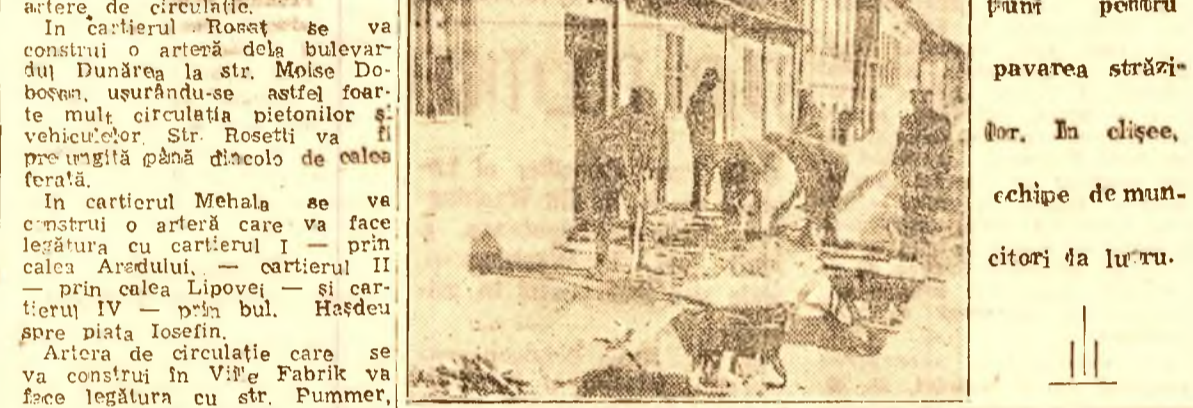
La Timișoara. Direcția tehnică municipală a hotărât punerea unei mari acțiuni pentru pavarea străzilor. În clișee, echipe de muncitori la lucru.