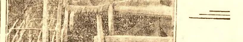
Echipa lui Motăchin dela uzina „Azovstal” la lucru. Drapelul Roșu primit pentru succesele în muncă îl însoțește pretutindeni unde lucrează.

Cine intră în orașul Soci are de admirat, pe lângă multe altele, în primul rând șoseaua „Stalin”, sau cu alte cuvinte