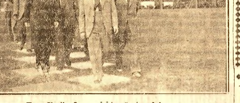
Tov. Vasile Luca vizitează strandul sportiv sunt realizări în folosul salariaților.