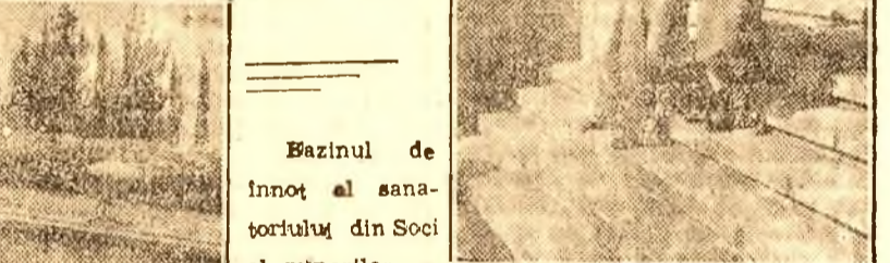
Bazinul de înot al sanatoriului din Soci al minerilor.

Ideia lui Lenin a fost imediat transpusă în practică. Dar nu