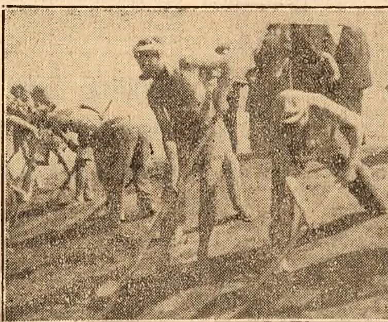
„Câteva clipe” încă și în sectorul grupei noastre digul a gata! Pe șantierul național „Ana Pauker” — Lunca Prutului, tinerii din brigada IV Brăila, se grăbesc să termine lucrările sectorului de dig dela punctul „Vadul lui Isac”. Ei vor să treacă fără întârziere în altă parte a șantierului căci marea întrecere începută la 1 Iunie între cele trei șantiere naționale nu privește sectoare de șantier ci șantierul întreg.

Pe șantierul național „ANA PAUKER” — Lunca Prutului