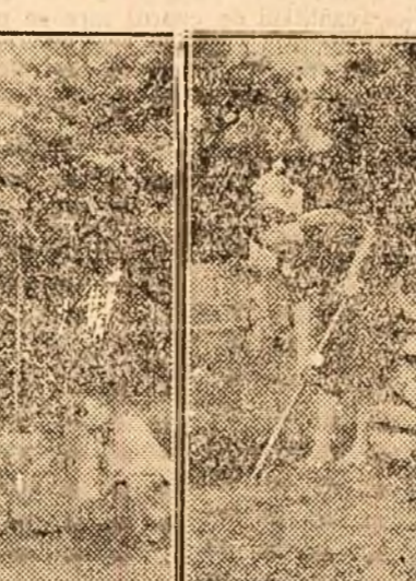
Muncitorii se pregătesc să scoată florile din seră. Iată-i în clișeu de mai sus, pregătind straturile și săpând gropile pentru plantarea arbuștilor tropicali.