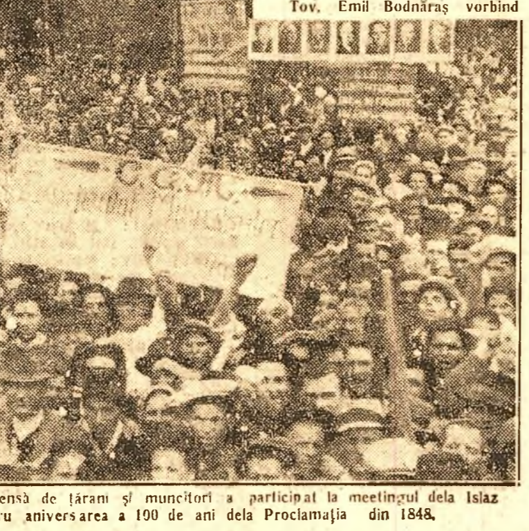
Tov. Emil Bodnaraș vorbind

Discursul tov. EM. BODNARAȘ Această înțelegere trădătoare înfăptuită în dauna poporului este Continuară în pag. III col. 1-4.