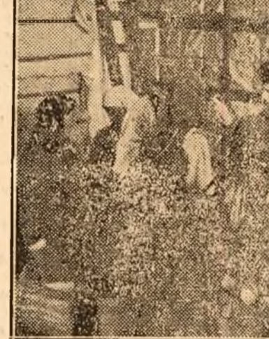
Rafturile centrului de distribuție din Hârlău sunt pline de pachete de bumbac. După ce au prelat porumbul, la „Romcreal” sătencele așteaptă nerăbdătoare să le vină rândul.

De cum s'a aflat că a venit bumbacul, pe omenii nu l-a mai răbdut inima să aștepte.