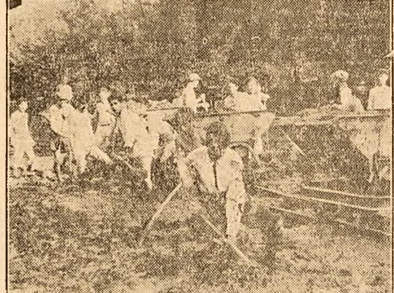
În clișeu: La Caracal U. T. M-istii au lucrat la despotmolierea lacului care se află în mijlocul parcului comunal, realizând în 735, ore 120 metri cubi pământ, săpași și cărat.

Ei fac parte din tinerii care nu s'au mai putut încadra pe șantierele naționale, dar lucrează cu spor în locurile unde se află.