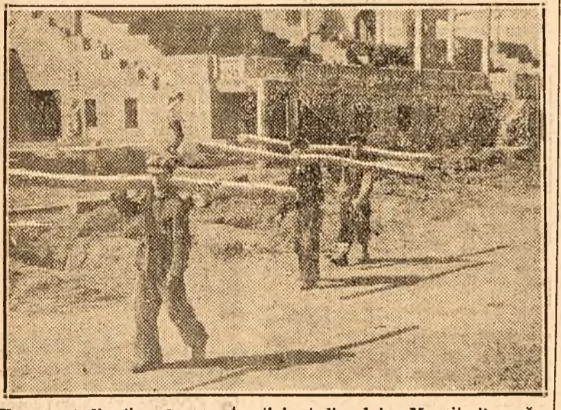
Un aspect din timpul reconstrucției stadionului. Muncitorii cărăi stâlpi necesari pentru împrejmuirea terenului