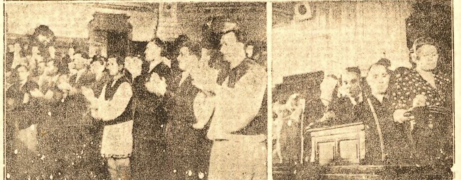
De stînga la dreapta: 1) Deputații aclamă îndelung pe tov. Gheorghiu-Dej, 2) Tov. Ana Pauker, Teohari Georgescu și Vasile Luca, votînd

LA „MALAXA” La chemarea prelungă a sirenei, peste 7000 de muncitori, tehnicieni și funcționari s'au întrunit în uzina sa sărbătoare de festivități. Continuare în pag. IV-a col. 4-8