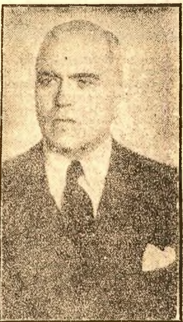
D. dr. PETRU GROZA

D. Dr. Petru Groza, președintele Consiliului de Miniștri, spune apoi, spre aprobare, Adunării, hotărîrea Consiliului de Miniștri preconizată în următorul comunicat: