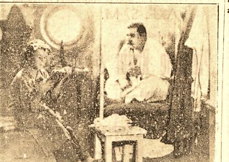
Scenă din filmul de mare succes „Copilăria lui Maxim Gorki” care rulează pe ecranele din Capitală