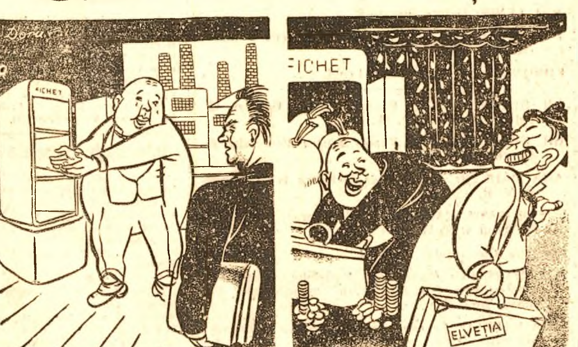
CAPITALISTUL — Nu vezi că nam bani, de unde să fac investiții? CAPITALISTUL — Să mi-i pui bine la o bonă străină, să sporta afară tot aurul țărilor.