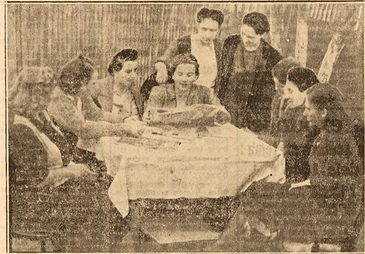
In str. Culcer 36, Comitetul de stradă citește și comentează un articol de ziar.

Panduri, spre Cotroceni, B.dul Geniului, toate acestea cu străzile laorale, până la Podul Elefterie, întregă această rază a Sectorului de Albatru, este câmpul de activitate al Circe 28, U.F.D.R.