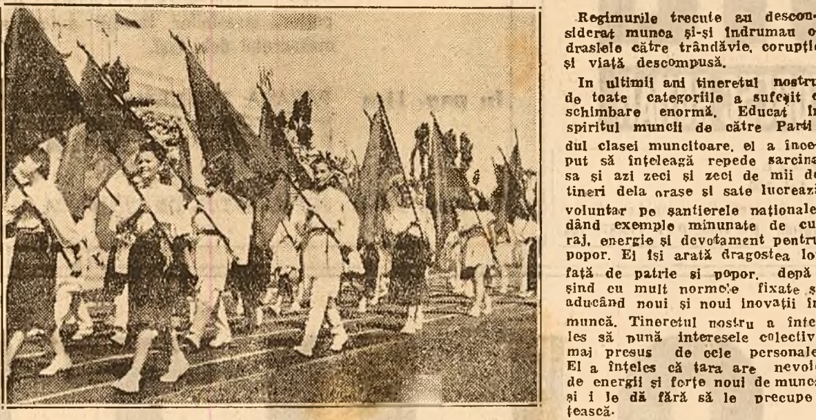
Un aspect al grandioasei „Parade a Tineretului Școlar”