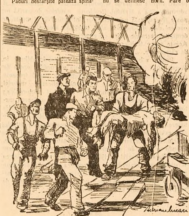
Ilustrație de Adrian Lucaci

Deasupra pãmãntului, peste pietre, peste vite și oameni, do-goaarea vãrãteacã a soarelui pã-trunde usturãtor, ca un gaz de rãzboi. Dincolo de șirul munților, fa-brica de locomotive se înalță ca o viã gigantice și turmurile ei asemenea unor gãluri de pãșari însetate, decoreazã gurile, din-tre piscuri. Pãduri nesãrșite pãteazã spinã-rile pietroase, într'un verde în-chis. Pe toatã întindeaza cerului, care se slãșie pe creștele mun-ților, în partea de miazã-noapte, nu se definesc norii. Pare o