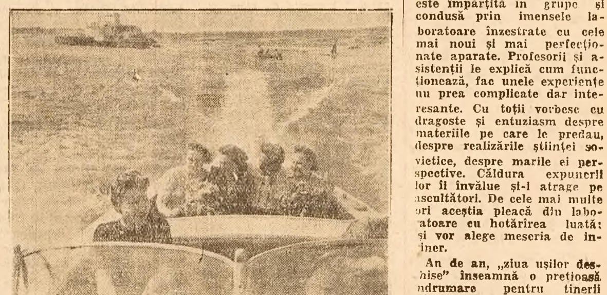
În zilele libere muncitorii fabricii de textile din Serpuhov se plimbă cu bărcile cu motor pe râul Oca.

După cum se vede, din aceste câteva aspecte, cluburile Leningradului se pregătesc de o activitate de vară intensă. Lucrul acesta se petrece, de altfel, în întreaga Uniune Sovietică. În afară de concediul pe care fiecare om al muncii din U.R.S.S. și-l petrece în cele mai bune condiții, organizațiile de Partid și sindicale, în colaborare cu conducerea administrativă a întreprinderilor, se îngrijesc ca și în orele libere pe care le au în perioada de producție, muncitorii să se poată odihni și să se destindă cu adevărat în cluburile și parcurile lor.