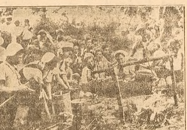
E vacanță, pionierii sînt în excursie. Nici o mîncare nu poate fi mai gustoasă decît cea pe care o gătesc ei înșiși la focul din pădure.

Adunarea generală a membrilor colhozului joacă un rol enorm în opera de educare a colhoznicilor. La această adunare oamenii hotărîsc ca niște adevărați stăpîni soarta gospodăriei lor. De inițiativă lor, de participarea lor activă la treburile și la conducerea gospodăriei colhozului depinde buna lor stare. Adunările generale ale colhozului reprezintă astfel o școală, în care colhoznicii învață construcția vieții socialiste, a vieții noi spre care i-a călăuzit Partidul.