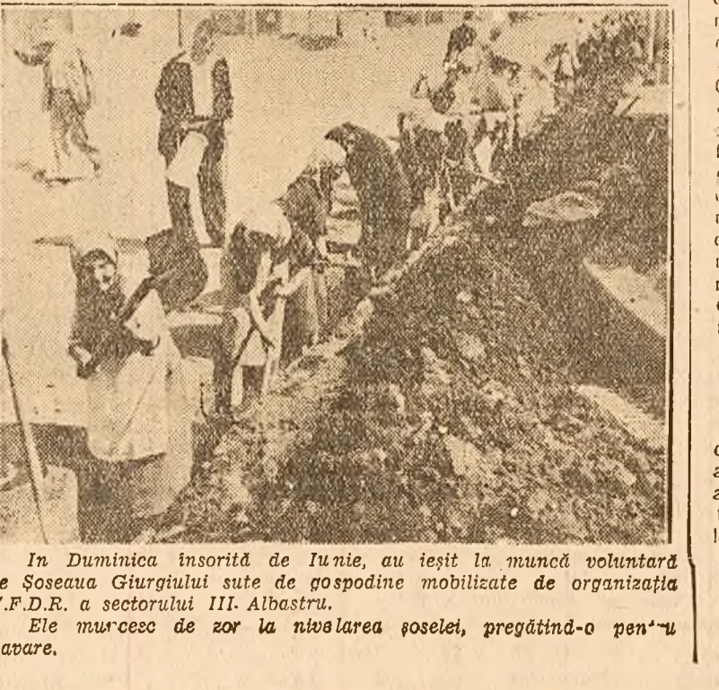
In Duminica însoțită de Lunie, au ieșit la muncă voluntară pe Șoseaua Giurgului sute de gospodine mobilizate de organizația U.F.D.R. a sectorului III. Alabastru.