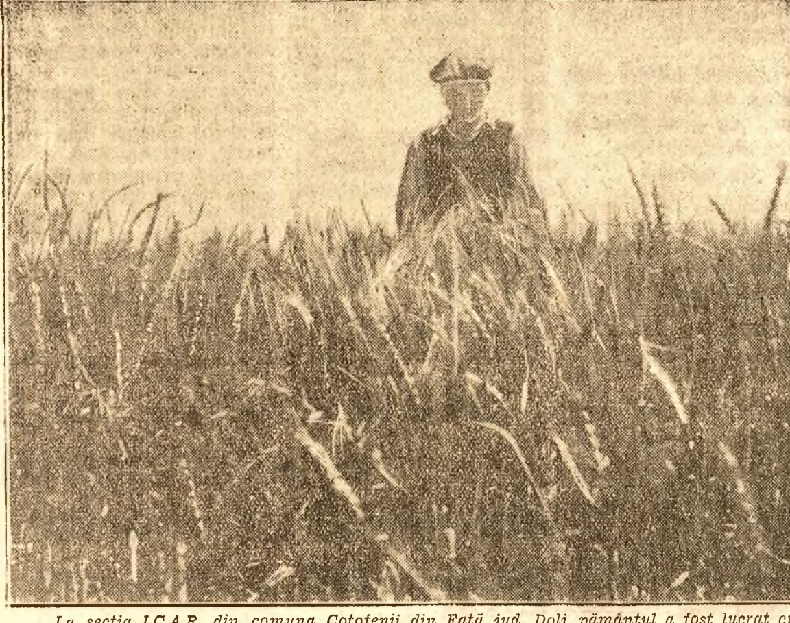
La secția I.C.A.R. din comuna Coțofeni din Fața jud. Dolj, pământul a fost lucrat cu tractoarele, iar însămânțatul s'a făcut cu mașinile de semănat. Iată acum, grâul a crescut înalt până la brâu.