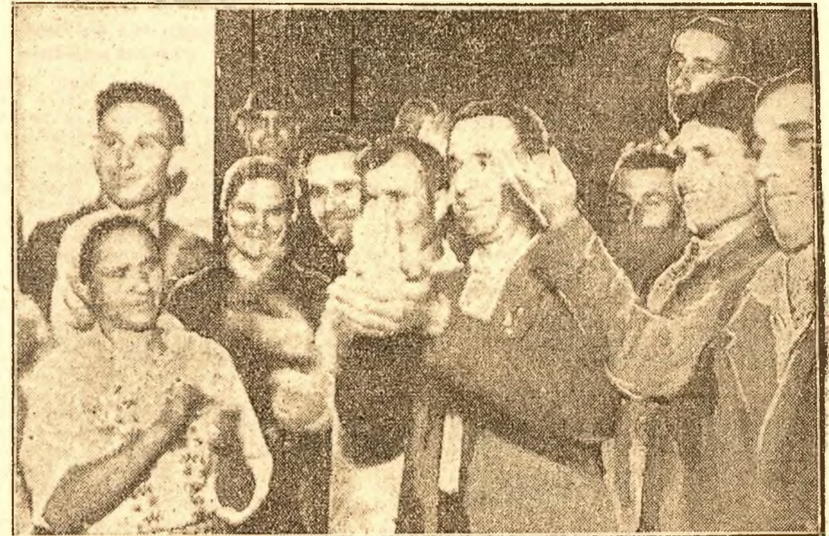
La recepția oferită de către S. I. Kavtaradze, ambasadorul Uniunii Sovietice, muncitorii înalpați din U.R.S.S. manifestează entuziasmul pentru Marea Țară a Socialismului și pentru genatul ei conducător, I. V. Stalin.