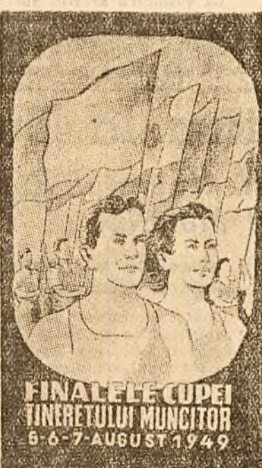
FINALELE CUPEI TINERETULUI MUNCITOR 5-6-7 AUGUST 1949