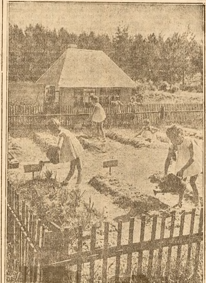
În grădinițele de copil din U.R.S.S., micuții cetățeni sovietici învață jucându-se. Iată-și îngrijindu-se de grădina de legume a grădiniței, unde au răzarat în miniatură cu legume de toate felurile.

Spicuri din bugetul colhozului Dar ce posibilități aveți pentru a putea păși la realizarea construcției? Cum stăți cu veniturile? fu întrebă Grigori Crasnov. — Destul de bine! Colhozul a avut anul trecut un venit de peste trei milioane ruble. În fiecare an cheltuiem aproape 500.000 ruble pentru lucrări de construcție, pentru a cumpăra mașini agricole, îngrășăminte chimice, vite de rasă, etc., și largim astfel gospodăria noastră colectivă. Astfel ea ne aduce din an în an venituri mai mari. Crește a-vutul gospodăriei colective și în același timp creșo și veniturile colhoznicilor. Oricine vine astăzi în colhozul „Ilici” este impresionat de construcțiile lucrărilor de construcție, dar și de înaltul nivel științific al muncii câmpului. Tot ce a dat știința miciruinistă prețios și înaintat se aplică pe ogoarele și în fermele colhozului „Ilici”. Ogoarele colhozului se află într-un ținut de stepă. Dar acesta nu mai arată ca o stepă obișnuită, ci este întretăiat în lung și în lat de perdele păduroase alcătuite din frasin, stejari și salcâmi. Ocrotite de aceste perdele păduroase, semințele nu suferă de urma secetei. Indiferent dacă plouă sau nu, colhoznicii străung totdeauna o recoltă bogată. Recolta medie este de 1500—2000 kg. la hectar, iar în unele sectoare recolta medie este chiar de 3000 kg. Pământul este lucrat la