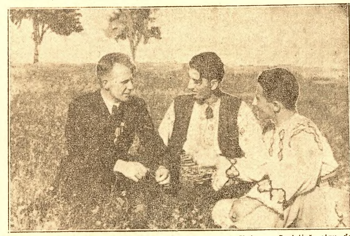
Țărani muncitori din R.P.R., care au vizitat Uniunea Sovietică, stau de vorbă cu agronomul unui colhoz, dela care primesc bogate dobandite de colhoznic.