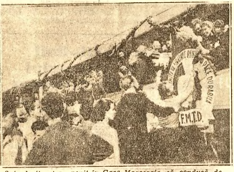
Sute de tineri au venit în Gara Mogoșoaia să conducă delegația tineretului muncitor din R.P.R. la Festivalul dela Budapesta.

Entuziasta manifestație din gara Mogoșoaia Eri dimineața la orele 10.30 a părăsit Capitala, delegația tineretului muncitor din R. P. R. la Festivalul Mondial dela Budapesta. Gara Mogoșoaia, împodobită de sărbătoare, cu lozinci și drapele, fremătă de veselie. Cei 480 de delegați care vor duce la Budapesta mesajul de luptă pentru pace al tineretului muncitor din țara noastră