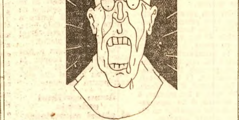
Și servitorul Domnului... excomunică

Wall-Streetul a hotărît devalorizarea lirei engleze (ziarele)