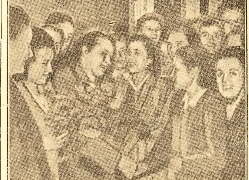
Un grup din delegația tineretului sovietic.

Ha sovietică a fost primită de către frunțașii Partidului celor ce muncesc din Ungaria, de membrii Comitetului executiv al F.M.T.D., de reprezentanții Uniunii Internaționale a Studenților, precum și de alte personalități. Oaspeții au fost întâmpinați cu ovații furtivoase și saluturi în cinstea marelui conducător al popoarelor, tovarășul Stalin, și a eroicului Comsomol leninist-stalinist. Delegația sovietică a intonat Imnul Național Ungar în limba ungară. În piața gării