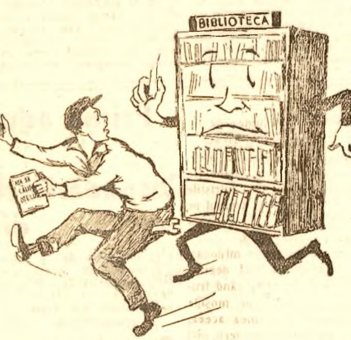
— BIBLIOTECA (cu sufletul la gură): Te mai rog tovarășe ca după ce o citești să nu uiți să mi-o aduci înapoi...

La APACA unui tovarăș uită să mi aducă înapoi cărțile luate dela bibliotecă.