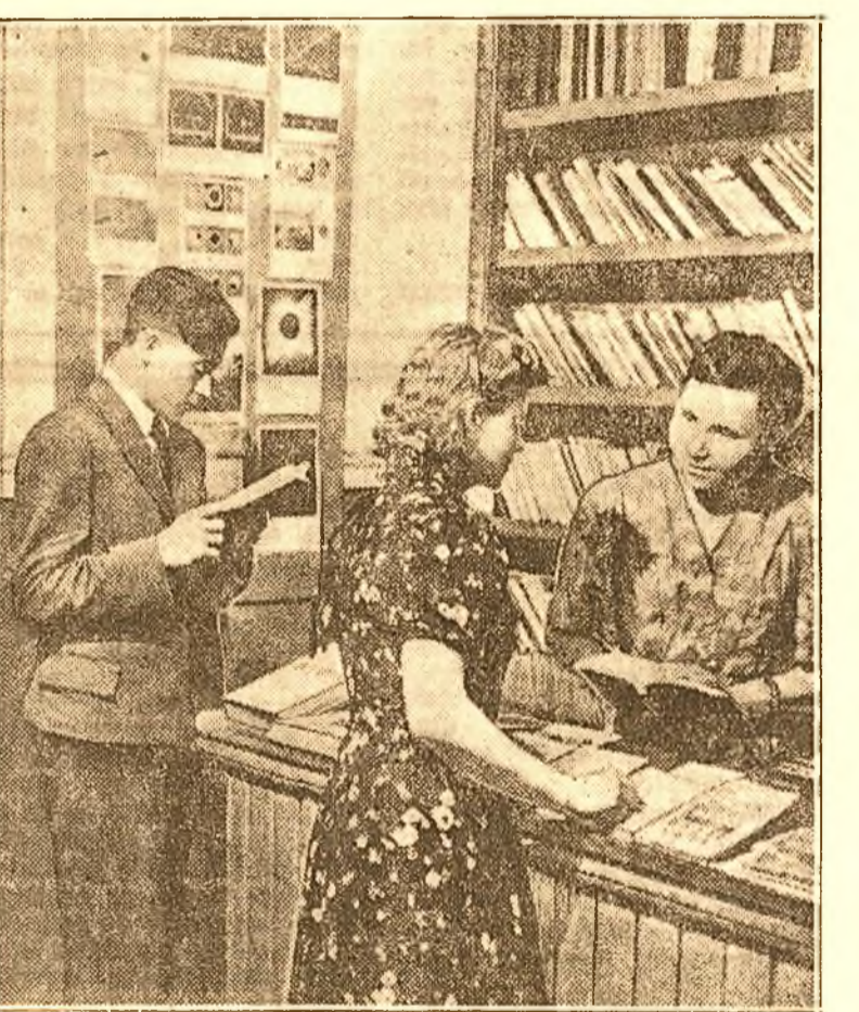
Clubul colhozului „Crasnăi Boreți” din regiunea Cuban pune la dispoziția sătenilor cărțile cele mai noi