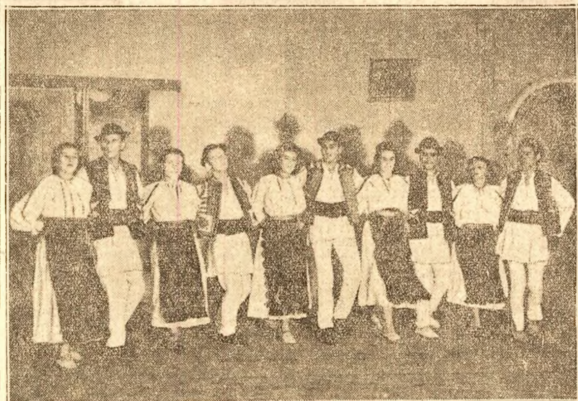
Ansamblul de dansuri al fabricii „Octombrie Roșu” repetă dansurile populare pe care le va executa la 25 Septembrie în piața 28 Martie.