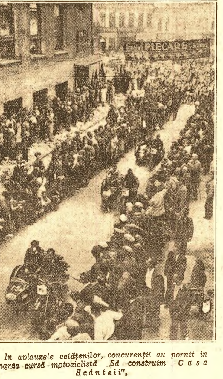
În aplauzele cetățenilor, concurenții au pornit în marea cursă motociclistă „Să construim Casa Scântei”.

95 de concurenți au plecat eri la ora 15 din fața redacției ziarului „Scânteia”. Sărbătoreasca primire făcută participanților dealungul parcursului