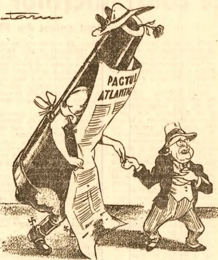
Truman: Lăsați-mă să vă aduc pacea lumii... (Desen de Taru)

Truman încearcă să prezinte popoarelor pactul Atlantic ca un pact „pacific”.