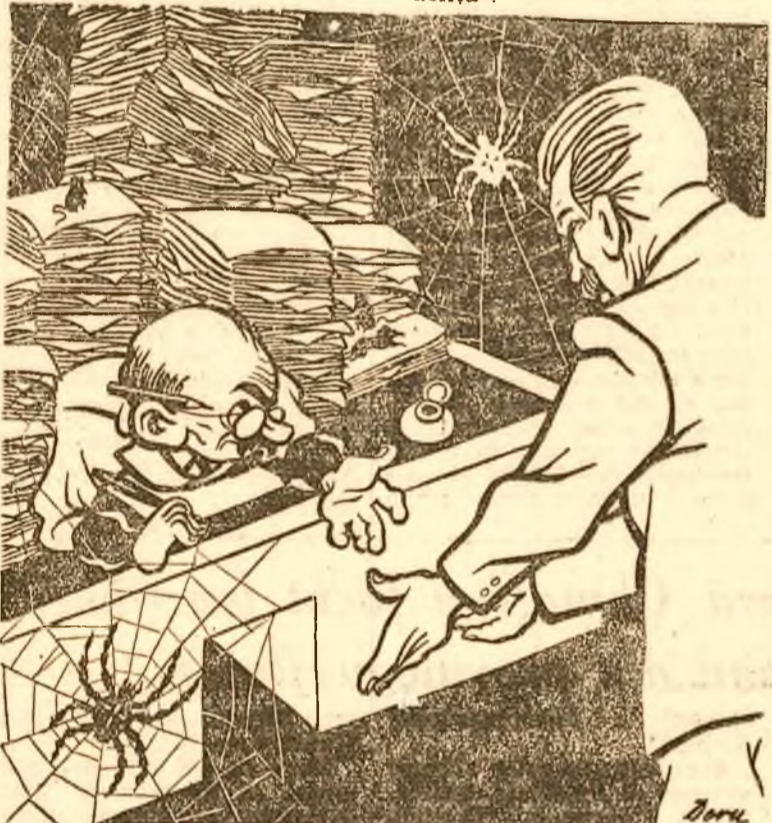
— Ce e cu cererea noastră? Am dat-o din Februarie. — Păi suntem abia în Septembrie... (Desen de Doru)

Cererile făcute de unele școli în Februarie-Martie la Ministerul Învățământului pentru acordarea de fonduri necesare noului an școlar, au stat la Direcția Contabilității timp de o lună, ca apoi să fie trimise la Direcția Administrativă, nerezolvate; aici au fost clasate la dosar „in evidență”.