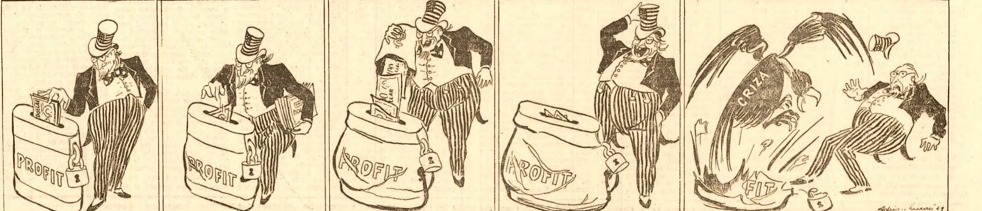
Desen de Adrian Lucaci