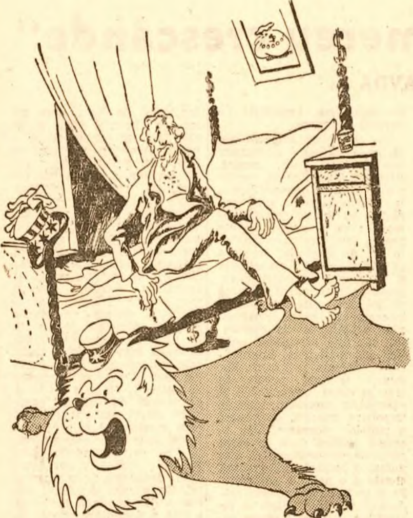
Sam: Ei sireacul, tot a fost și verșorul meu bun la ceva...