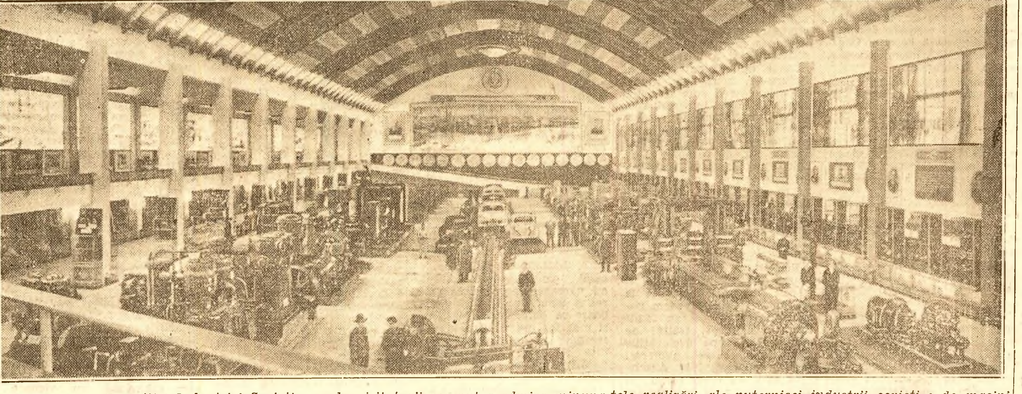
Eala mare a Expoziției Industrii Sovietice unde vizitatorii vor putea admira minuna tele realizări ale puternicei industrii sovietice de mașini

Mișcarea democratică din sânul poporului german, sub conducerea proletariatului și a Partidului său, pornește la o luptă grea. În această luptă, Republica Democrată Germană va fi o puternică armă, căci crearea ei reprezintă O NOUA ȘI MARE VICTORIE A FORTELOR PROGRESULUI SOCIAL. Nu încapă îndoială că în Germania vor triumfa forțele progresiste, căci poporul german a găsit acel reazim de granit pe care nu l-a avut: marea Uniune Sovietică în jurul căreia se află democrațiile populare și mișcarea mondială pentru pace.