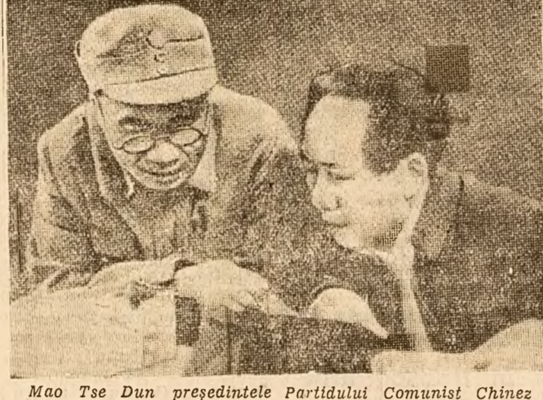
Mao Tse Dun, președintele Partidului Comunist Chinez și președintele guvernului popular central al Republicii Populare Chineze și Ciu Deh comandantul Suprem al Armatei Populare de Eliberare

Ciang Kai-Shek împotriva conducătorilor mișcării muncitorești din China, a început lupta crâncenă între cele două curente din zăbucimata istorie politică a acestei țări. Din ce în ce mai mult a degenerat Ciang Kai-Shek trădând revoluția chineză, transformându-se în protectorul exploatarii moșierilor, în patronul funcționării corupte și putrede până în măduva oaselor, în vătaful