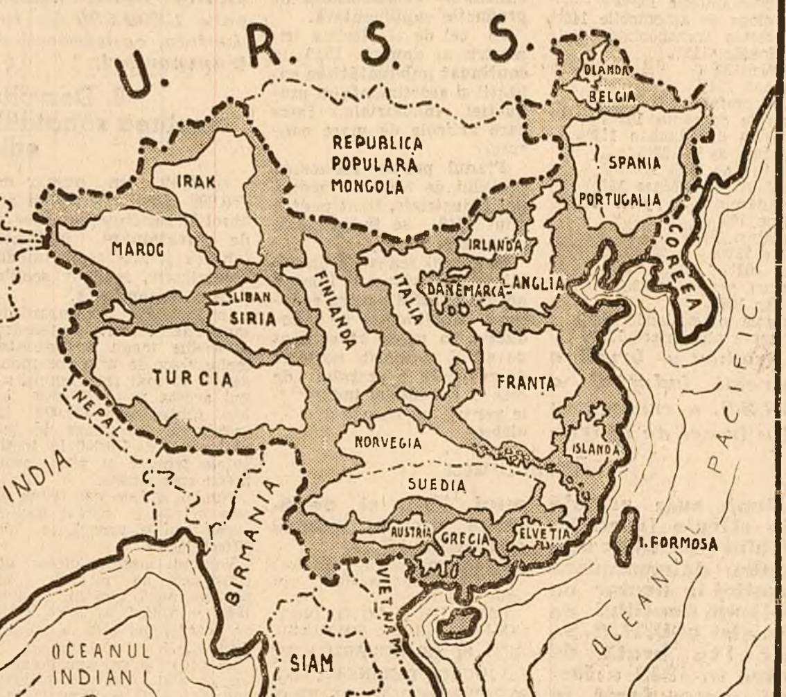
China, o țară cât un continent cu o întindere de 10 milioane de km², s'a alăturat frontului păcii, socialismului și democrației. Pe această hartă se poate vedea că teritoriul Chinei înțrece în suprafață zeci de țări capitaliste luate împreună.

În teritoriile eliberate inflorește o viață nouă Consecvența poliției revoluționare a Partidului Comunist Chinez în teritoriile eliberate stă la temelia de neștrănuț a victoriilor istorice ale Armatei Populare Chineze, la temelia sprijinului necuprețit pe care poporul chinez îl dă forțelor populare. Reforma agrară, suprimarea datorilor apăsătoare ale țărănilor față de marii moșieri, realizate în teritoriile eliberate din Nord, au în-