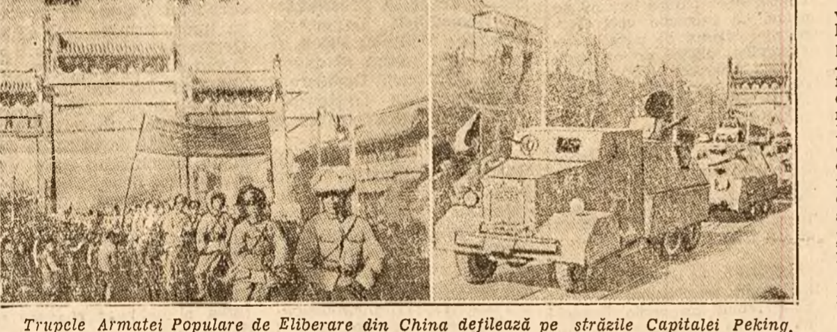
Truplele Armatei Populare de Eliberare din China defilează pe străzile Capitalei Peking. În câștig: Regimente motorizate și cavalerie