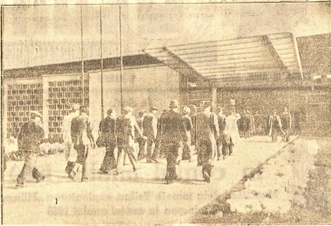
Muncitorii și tehnicienii dela diferitele uzine din Capitală vin în grupuri să viziteze „Expoziția Industrii Sovietice”. În alisur: Unul din aceste grupuri, intrând în marea sală a mașinilor unice

Lume din ce în ce mai multă la Expoziția Industrii Sovietice. Vin muncitorii să vadă mașinile ce stă atitudine greșită a dus la situații ca cea din luna August, când „Alimentara” din București a realizat numai 60 la sută din planul său lunar de vânzări, deoarece s'a mărât numărul și valoarea mărfurilor aduse în vânzare.