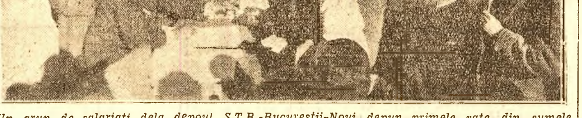
Un grup de salariați dela depoul S.T.B.-București-Nouă depun primele rate din sumele subscrise acum câteva zile pentru construirea „Casei Scântei”.

A început vărsarea primelor sume de bani pentru „Casa Scântei”