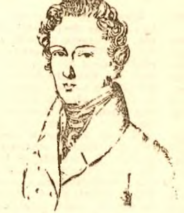
Desen de F. Dietrich (1939)

În 1849, la Paris, înainte de a muri, el a cerut ca după moarte inima să-l fie dusă în Patrie. În timp ce Polonia era copleșită de fasciști, un oarecare oberleutnant a încercat s'o fure. Câțiva patrioți, luptători din mișcarea de rezistență poloneză, au ascuns-o și au păstrat-o. Au păstrat-o inima lui Chopin ca pe un bun scump întregul lor popor, ca pe un sîndar scump tuturor popoarelor lumii. Au păstrat-o trăcându-și tăina ascunzătorii din om în om, de multe ori în focul luptelor, de multe ori în limbă de moarte, deavalma cu numele copiilor, al libertății, al soției, al Patriei, al părinților și al prietenilor.