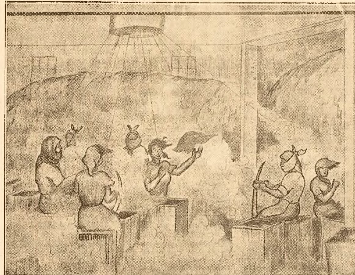
Din gazeta de perete a fabricii 'Stea Roșie'-Bacău