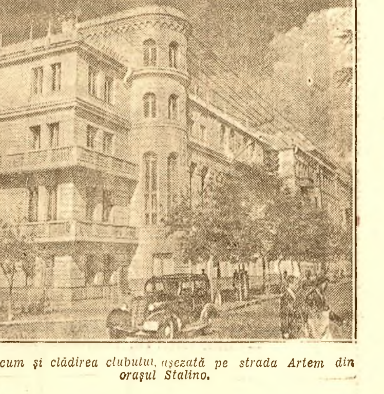
Iată acum și clădirea clubului, ușcată pe strada Artem din orașul Stalino.