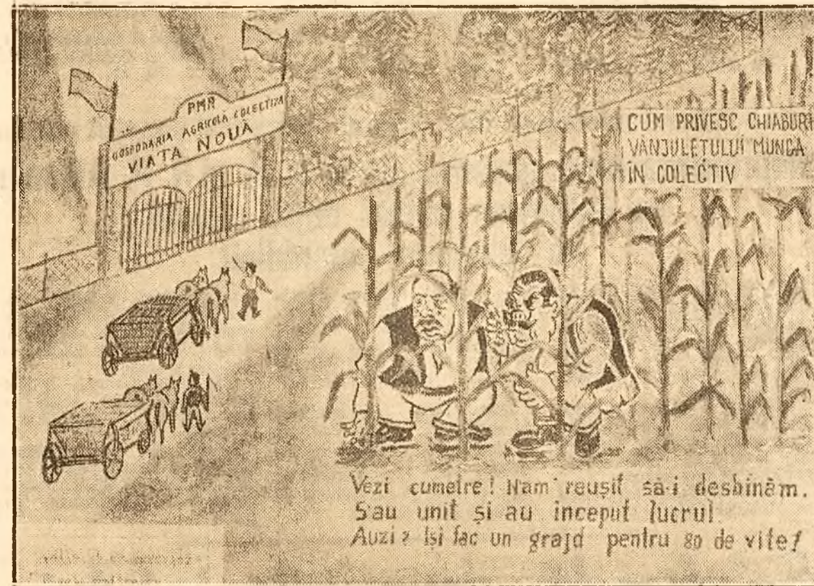
Din gazeta de perete a Gospodăriei Agricole Colective 'Viața Nouă' din com. Vânzuleț...