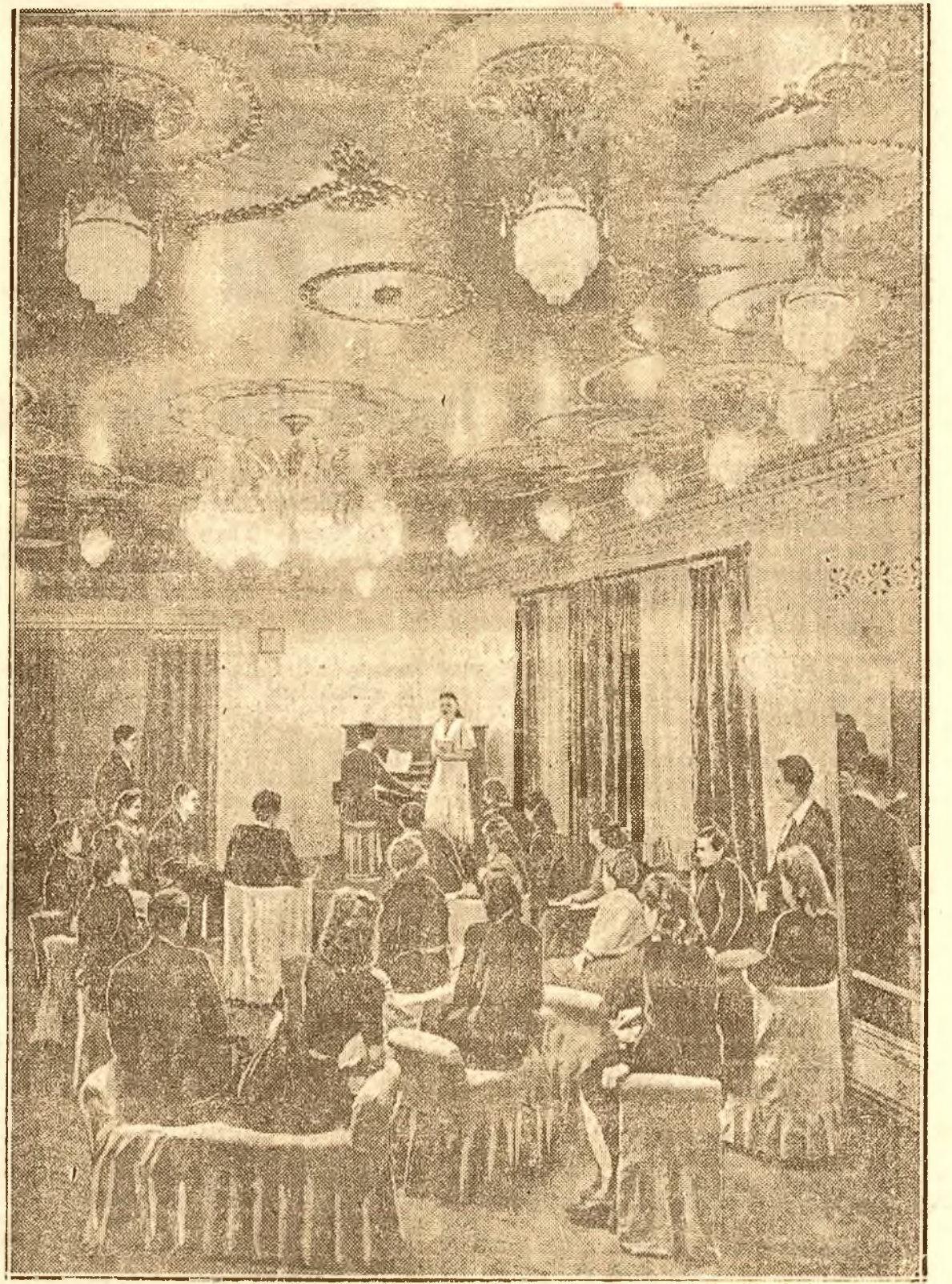
Concert de muzică de cameră într'una din camerele clubului minerilor. Aceste saloane au loc cu concursul artiștilor profesioniști, ca și al minerilor, inginerilor, funcționarilor și membrilor din familiile lor, care fac parte din cercurile artistice ale clubului.

Acest număr uriaș este un rod al Marii Revoluții Socialiste din Octombrie, al eforturilor depuse de popoarele sovietice pentru construirea socialismului și azi pentru construirea comunismului. S'a ivit o nouă societate — societatea sovietică — și un nou om — omul sovietic. Cluburile acestea reflectă în ele pe omul sovietic și societatea sa. În țara noastră, luptând pentru mărirea productivității muncii pentru împlinirea și depășirea Planului de Stat, mergând înainte pe calea construcției socialiste, vom isbuti să avem și noi, după exemplul sovietic, tot mai multe astfel de cluburi. Înconjurând cluburile sindicale pe care le avem acum și cele ce se vor ridica în decursul construcției socialiste, cu grija, atenția și dragostea pe care am văzut-o la oamenii sovietici, vom face din cluburile sindicale adevărate arme de ridicare culturală, ideologică și profesională a oamenilor muncii din R. P. R.