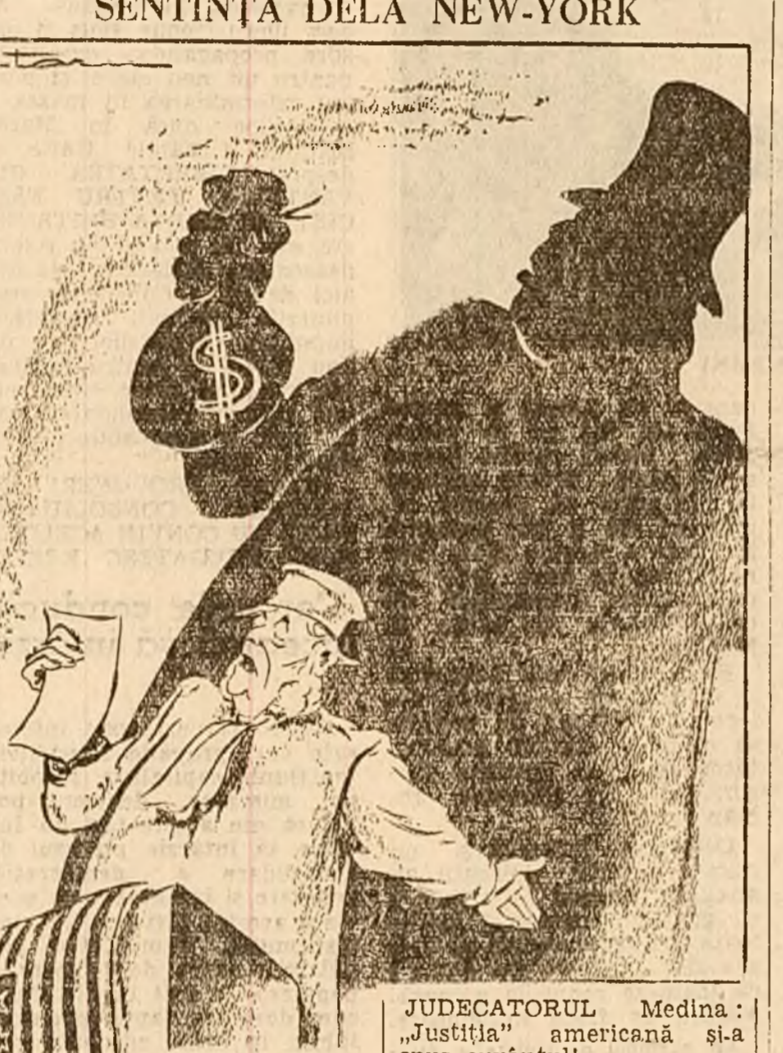
JUDECĂTORUL Medina: „Justiția” americană și-a spus cuvântul! Desen de Eug. Taru