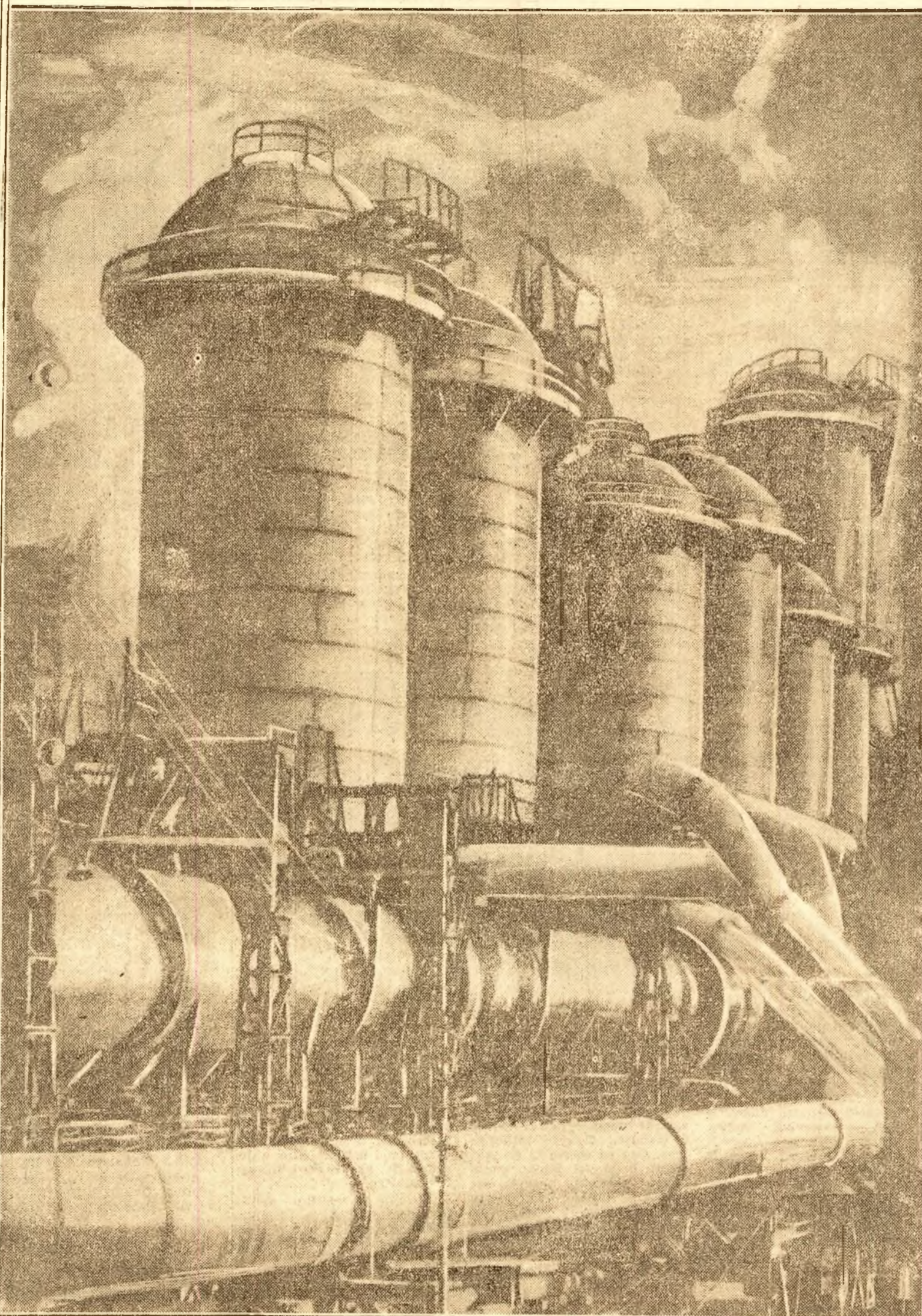
Uzina siderurgică „Petrovski” din Dnepropetrovsc face parte din gigantul siderurgiei sovietice. Fruntașă în îndeplinirea planurilor de producție, ea dă Patriei Sovietice tot mai multă forță și oțel.

„... În ce privește producția energiei atomice, agenția TASS socotește că este necesar să reamintească faptul că încă la 6 Noiembrie 1947 ministrul afacerilor externe al U.R.S.S. a făcut o declarație în legătură cu secretul bombei atomice, subliniind că „acest secret nu mai există de mult”. Această declarație însemna că