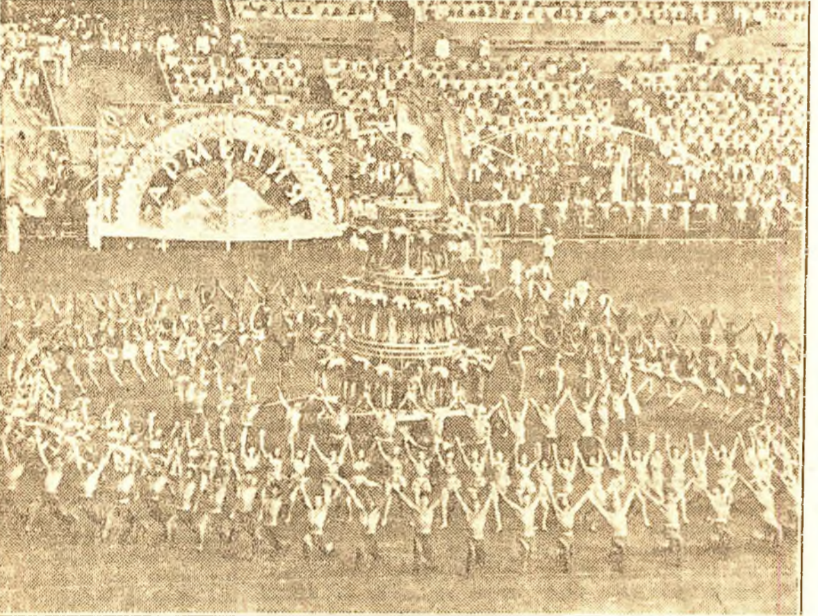
La Parada Sporturilor dela Moscova delegația de sportivi a R.S.S. Armeană execută gimnastică de ansamblu

Trăiască Republica Sovietică Socialistă Ucraina! Deosebita Prezidiului Sovietului Suprem al U.R.S.S. a adresat un salut Prezidiului Sovietului Suprem al R.S.S. Bielorusia, cu prilejul împlinirii a zece ani dela reînnoirea poporului bielorus într-un singur stat al R.S.S. Bielorusia.