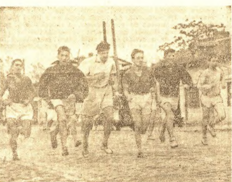
Pe șoseaua Giulești, concurenții se întrec pentru calificare.

Deși vremea nu a fost favorabilă, cel de al doilea cross de calificare desfășurat Duminică dimineața a cunoscut un mare succes.