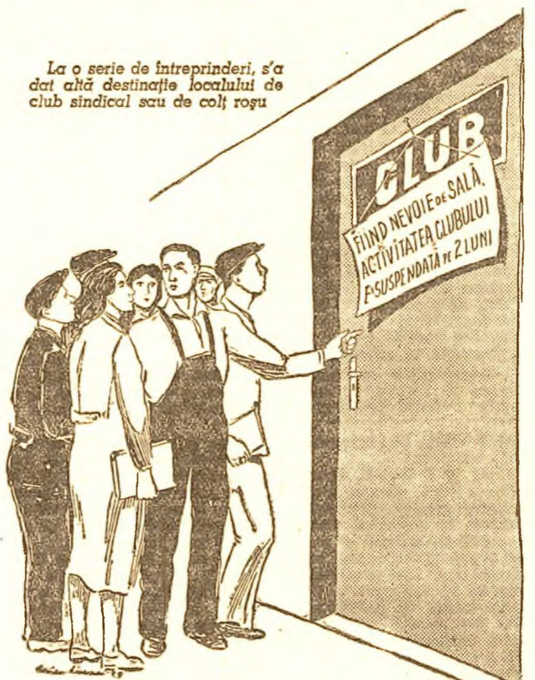
Desen de Adria. Lucaci