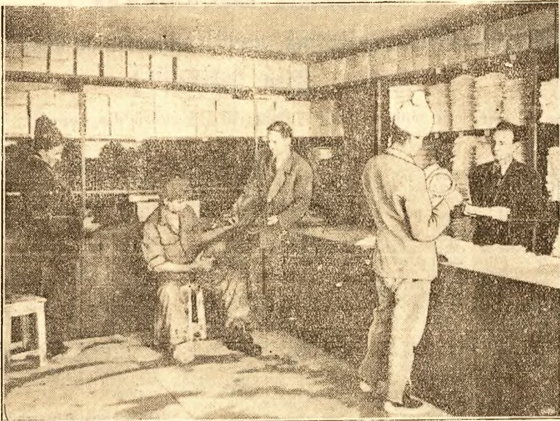
Rafturi dolidora de măruri de sus și până jos stau la dispoziția muncitorilor de pe șantierele Canalului. În cliseu: Cooperativa de îmbrăcăminte dela Poarta Albă.

A fost odată plaja mării, întinsă, întinsă — și golășă. Doar valul de nisip și ierburile chircite de arșiță. Așa o fost... Până când vara aceasta primele camioane au tăiat urme adânci în nisipul fierbinte și primii constructori ai Canalului au pornit la treabă. De atunci pustul n'a mai avut pace. Dela o zi la alta șantiierul își schimbă înfățișarea. Și, prin luptă biruitoare împotriva greutăților, condițiile de trai se îmbunătățesc și ele fără încetare.