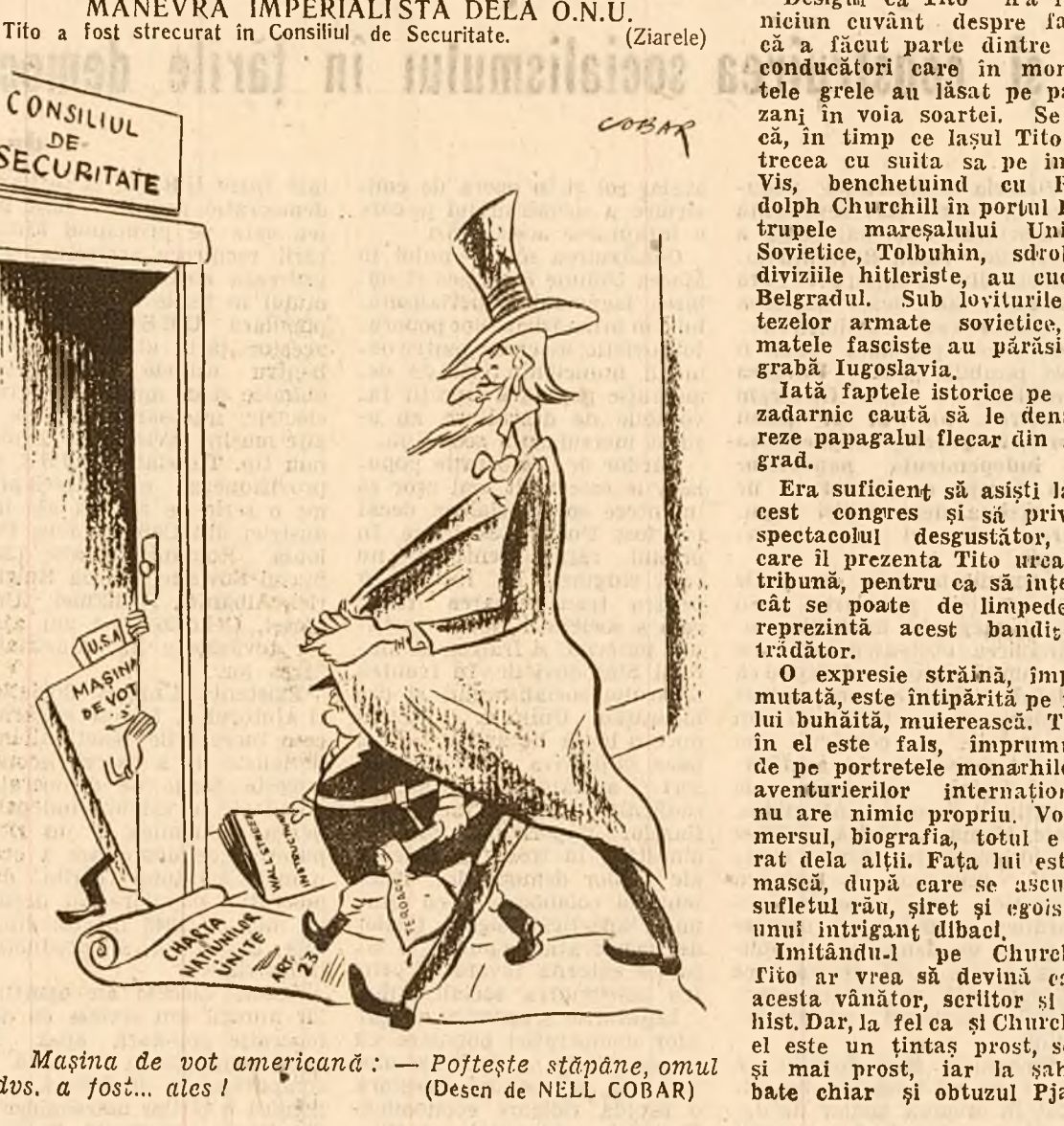
Mașina de vot americană: — Poftesc stăpâne, omul dvs. a fost... ales!