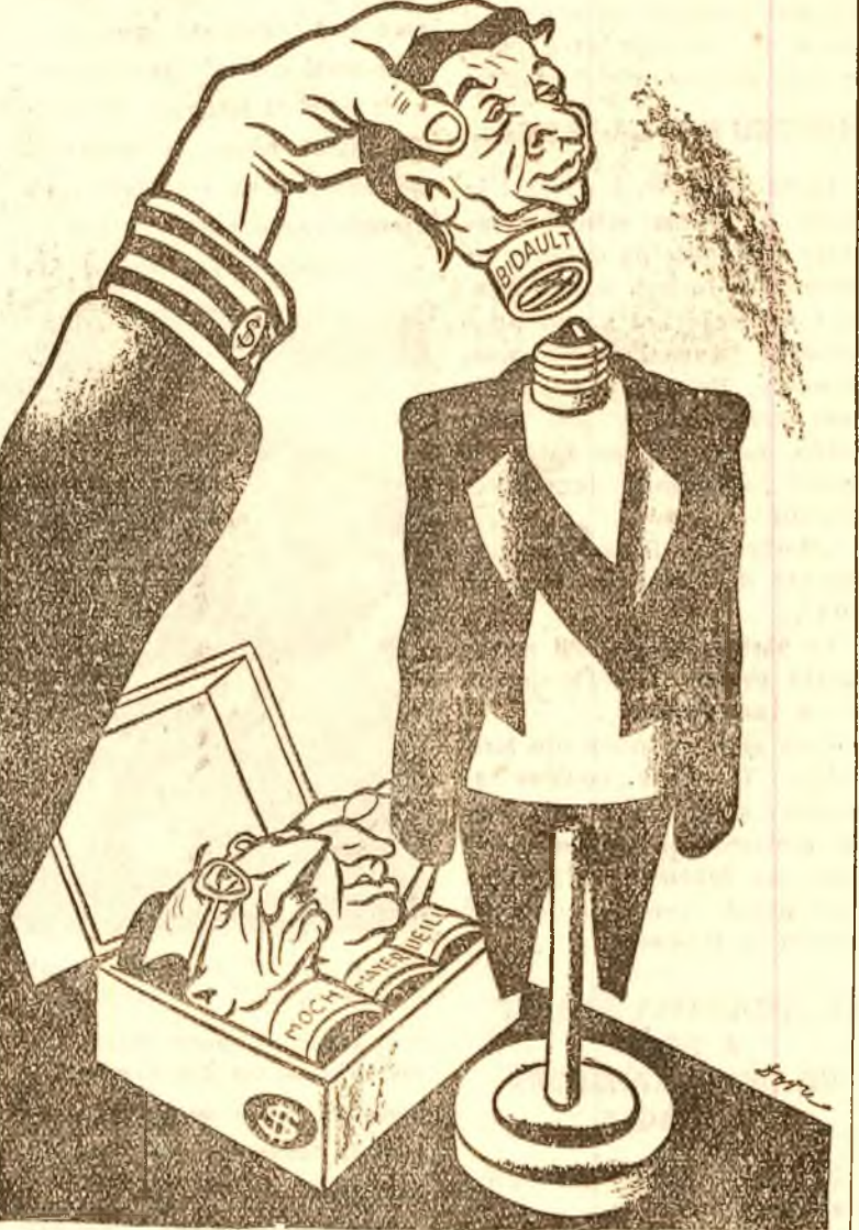
Desen de DORU