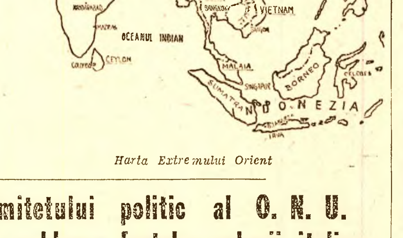
Harla Extremității Orient