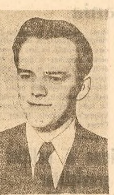
Maestru LUDEK PACHMAN campionul Republicii Cehoslovace