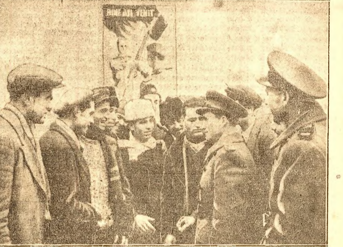
La Cercurile Teritoriale tinerii recruți din noul contingent sunt primiți cu toată dragostea, lălu-lă, ascultând plini de voie bună sfaturile date de tovarășii subofițeri.